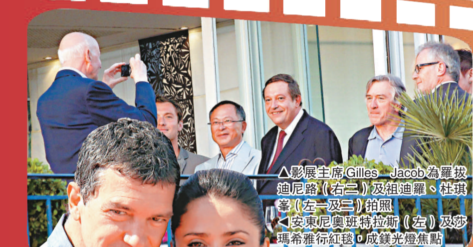
▲影展主席 Gilles Jacob 為羅拔迪尼路 (右二) 及祖迪羅、杜琪峯 (左一及三) 拍照 ▲安東尼奧班特拉斯 (左) 及莎瑪希雅行紅地毯，成鎂光燈焦點