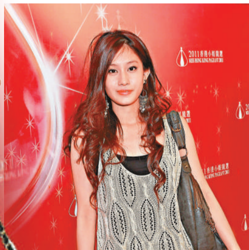
▲這位參賽者打扮夠青春