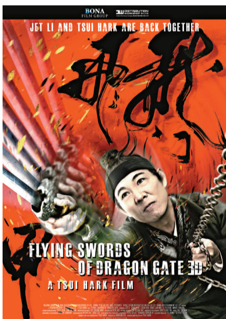
▲《龍門飛甲》承接了徐克與李連杰對功夫片的夢 ▲甄子丹、金城武及湯唯在《武俠》中均有突破演出

法國當地時間五月十一日，一張李連杰揮「疊影」劍的艷紅色海報登上了當日出版的《The Hollywood Reporter》封面。這款《龍門飛甲》的海報，為華語影片打響了在第64屆康城電影節的頭炮。