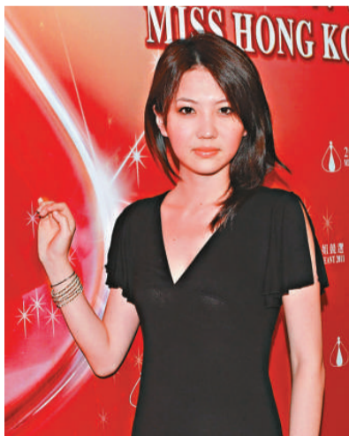
▲這位參賽者打扮夠青春