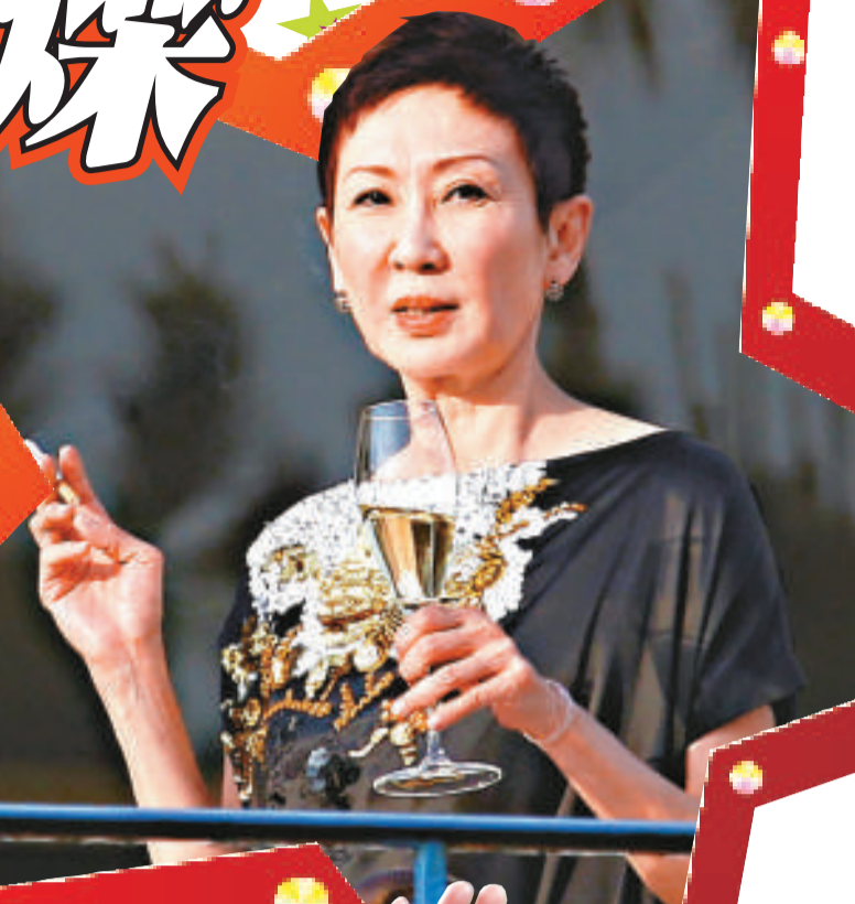
▲施南生認為評審準則視乎不同電影而定，不過講故事一定是基本的 ▼布魯尼 (左) 客串活地亞倫的電影，但卻因事未能到康城宣傳

而積伯克 (Jack Black)、安祖蓮娜祖莉 (Angelina Jolie) 及德斯汀荷夫曼 (Dustin Hoffman) 亦於昨天抵達康城，為動畫《功夫熊貓2》(Kung Fu Panda 2) 宣傳。換言之，無論場內場外，今屆康城影展都甚具睇頭。第64屆康城影展於五月十一至二十二日舉行。