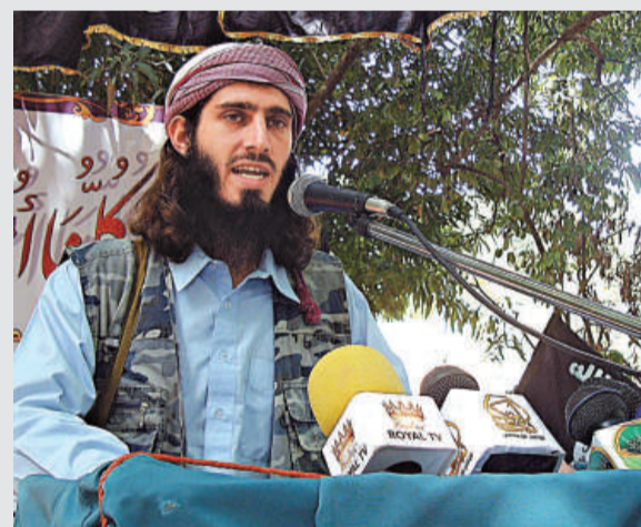
▲一名美國出生的伊斯蘭聖戰士11日在索馬里召開的伊斯蘭教會會議，支持為拉登復仇 法新社