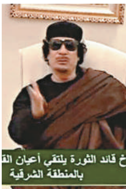
▲卡扎菲11日在利比亞國家電視台露面