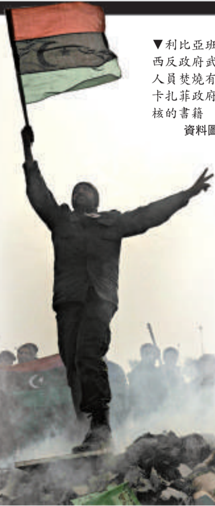
▼利比亞班加西反政府武裝人員焚燒有關卡扎菲政府審核的書籍 資料圖片

此外，利比亞反對派武裝11日在戰場取得重要進展，宣稱已經控制了利第三大城市米蘇拉塔的大部分地區。利比亞反對派武裝和政府軍爭奪米蘇拉塔機場等重要軍事目標的戰鬥已持續近兩個月。反對派武裝稱，政府軍當天棄守陸地後撤。反對派當晚在米蘇拉塔加西等地慶祝勝利。政府軍方面沒有就米蘇拉塔戰局的發表評論。