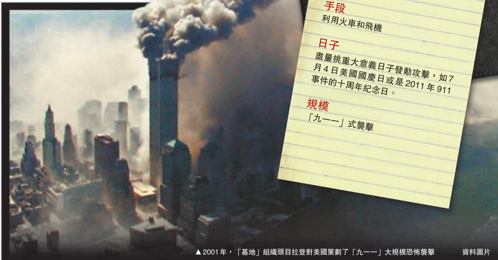
▲2001年，「基地」組織頭目拉登對美國策劃了「九一一」大規模恐怖襲擊