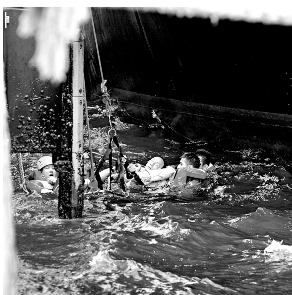
▲遇溺老翁被消防員救起