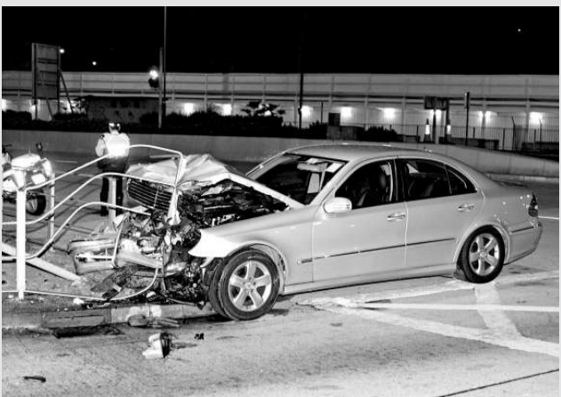
▲肇事平治房車嚴重損毀

心臟科醫生指出，中年人士在運動期間突然昏迷猝死，大多數與隱性心臟病有關，因人體四十歲過後心血管功能會漸衰退，如膽固醇過高，血管情況會更差，故建議市民在四十歲過後，應每年驗身檢查心肺及循環系統。