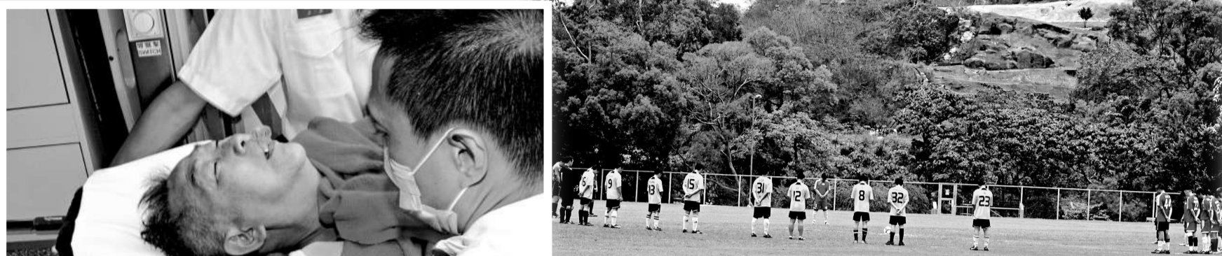
▲醫院傳來死訊後，眾人在第二場賽事開始前默哀悼念