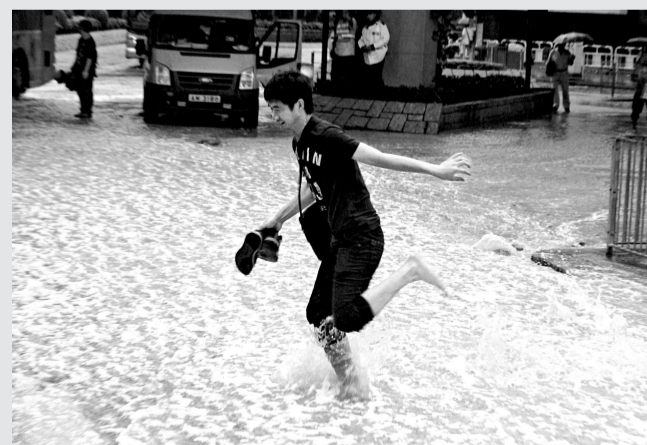
▲鹹水沿斜路流落加士居道引致水浸

現場為九龍塘浸會大學。據浸會大學發言人表示，自本月初開始，校園內同一幢建築物內相繼發生兩宗辦公室爆竊案件，有教職員發現財物被偷去，於是報警求助，並加強學校保安。九龍城警區特遣隊探員到場調查，並透過閉路電視鎖定一名目標男子展開調查。探員初步分析，估計疑犯會繼續作案，於是連日派員在同一幢建築物內埋伏監視。直至昨晨約十時，探員發現目標男子再次出現，潛入同一幢建築物內到處徘徊，其間疑趁教職員授課之際，潛進其中一間辦公室內搜掠，探員隨即採取截查行動，在其身上檢獲懷疑偷來的他人財物。