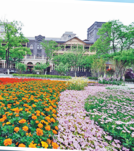
▲天津安道英式風情區的一、二、三號相繼落成，英式風情格調初具規模

記者從天津市旅遊局獲悉，天津今年將增加一批旅遊景點，目前，楊柳青民俗大院、年畫博物館、濱海觀魚休閒園（一期）等項目已建成納客；佛羅倫薩小鎮主體已完工，預計5月底開業；濱海花卉觀賞園（一期）主體已完工，預計8月試運營；凱旋王國主題公園將於「十一」前建成開業；萊茵小城、泰安道英式風情區、米立方水世界、盤山綜合服務區等項目將於年底前建成開業；東麗湖華僑城、濱海湖休閒度假中心、盤龍谷影視城、中國北方石林園等項目正加快建设。 天津市今年第一季度接待入境遊客42.53萬人次，同比增長17.4%，旅遊外匯收入3.9億美元，同比增長22.3%；接待國內遊客2600萬人次，國內旅遊收入330億元，同比分別增長15%和17.9%。