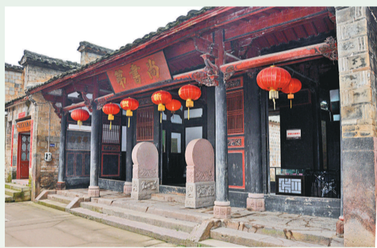
▲明代民居尚書第建築群

閣四部分，所有建築均建於寺內。從山腳下仰望，遊客只見一根粗大的柱子從地面拔地而起，撐托起了四幢重樓疊閣，整座寺廟屋頂沒有使用片瓦，全部建築木質，工藝精湛，巧奪天工，雕樞畫棟，另具一格。 甘露岩寺的這種「一柱插地，不假片瓦」的建築風格，是我國建築史上的一大傑作，聞名中外。據考證，十二世紀時日本名僧重源法師曾三度入閩考察，學習甘露岩寺的建築工藝，回國後重建了現為日本世界文化遺產的奈良東大佛殿，大佛殿所大量使用的「T」形頭拱即取樣於甘露岩寺，被譽為「大佛樣」。