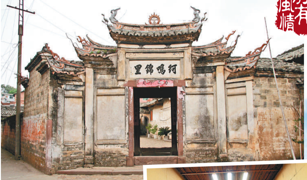
▲具有200多年歷史的古書坊——子仁屋

的斷語。 非物質文化遺產，應該是一種活躍的文化，在活躍中傳承和保護。就如連城當地一名幹部對記者說的，文化，要在動手體驗中才能活起來。如今，連城縣正計劃打造一個「中國南方明清時期出版印刷發行工藝流程展示中心」。有關工作人員興奮地展望：希望有關方面能通過這個中心，把連城宣紙和四堡雕版結合起來，在展示的同時，讓遊客自己動手造紙和雕版，再把印成品帶回去作紀念。 我們也衷心期待，未來再踏上四堡，能實現雕版印刷的DIY夢。