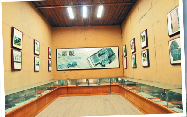
▲展覽館展示了明清時期保存下來的古雕版354塊、古書籍375冊

到了四堡，一定要到雕版印刷的生存環境——古書坊探尋一番。 目前，四堡保存較為完好的古書坊有80餘座，古書坊建築群主要分布在四堡的馬屋片區和霧閣片區。這些古書坊建築大多是集起居生活、印刷作坊、教育娛樂等多功能於一體的清代家庭作坊式建築。