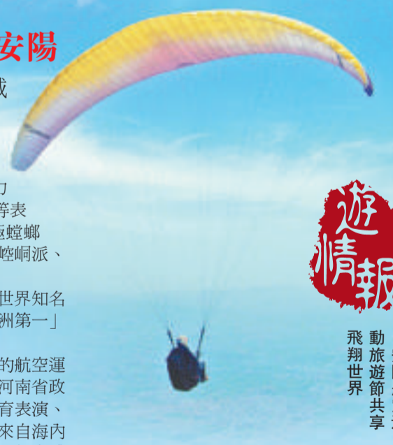
▲安陽航空運動旅遊節共享

第三屆中國安陽國際航空運動旅遊節將於5月22日至6月6日在古都安陽舉行，活動包括特技飛行、飛機跳傘、動力傘、動力懸掛滑翔機、熱氣球、航空模型等表演，還有中國武術少林派、太極螳螂拳、崑崙派、青城派、峨嵋派、崆峒派、梅花拳的武術表演。 安陽林澗山國際滑翔基地是世界知名的滑翔基地，有「世界一流，亞洲第一」和「滑翔聖地」之稱。 安陽市市長張笑東說，今年的航空運動旅遊節升格為國家體育總局和河南省政府共同主辦，期間安排了航空體育表演、賽事和通用航空博覽會等活動，來自海內外的參賽隊員和賓客將走進安陽，親身感受中原文化的博大精深和安陽山水的綽約風姿，享受一場精彩的航空盛宴。 安陽是中國八大古都之一，世界文化