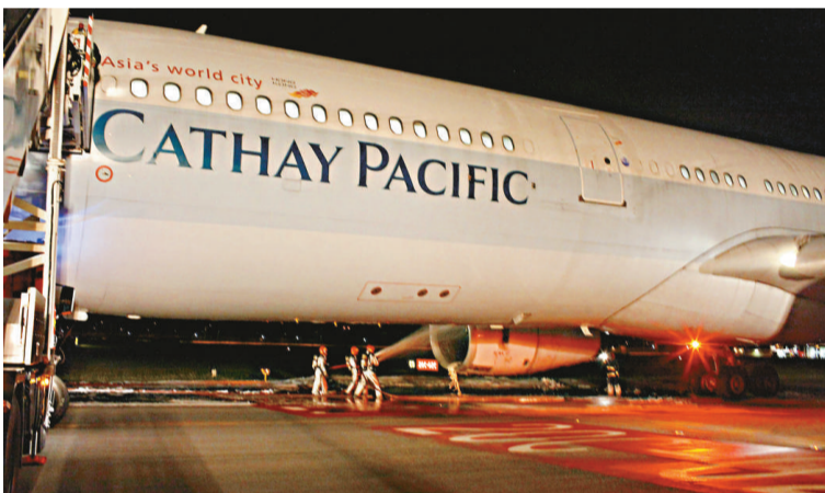
▲消防人員在新加坡樟宜國際機場撲滅折返的國泰 A330 引擎出現的火花

國泰近數十年的安全紀錄良好。但近年該公司的 A330 客機頻頻發生事故。2010 年 4 月，國泰一架 A330 客機快將抵達香港時，因機上兩個引擎都出現故障，而要在當地緊急降落。由於著陸速度遠較正常快，制動系統過熱，造成起落架起火。8 月，香港民航處稱事件起因可能在於燃料污染。 1997 年，國泰因旗下 A330 客機的 700 引擎出現問題，導致該公司整支 A330 客機機隊要停飛近兩周。引擎的問題導致引擎多次在飛行途中關掉，觸發國泰停止這些飛機服務，作出緊急改良。 國泰和與它屬同一集團的港龍航空公司目前共有 50 架空中巴士 A330-300 客機服務，主要飛往區域航線及澳洲航線，令國泰集團成為這種飛機的全球最大操作者。