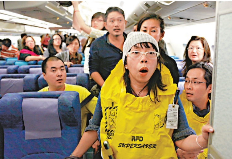
▲國泰 A330 客機上的乘客準備出艙