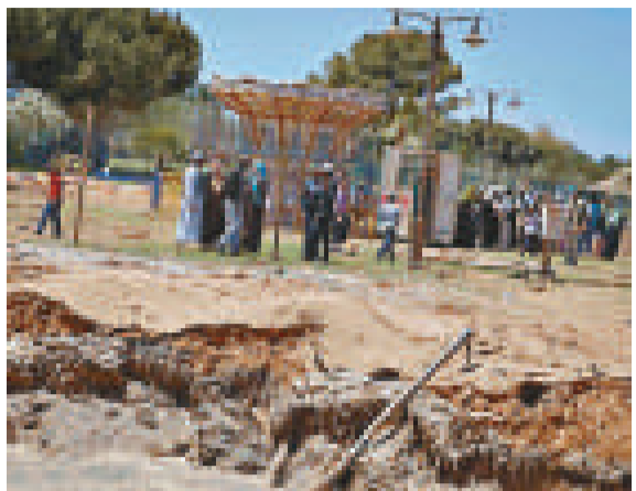
►的黎波里的一個兒童樂園，卡扎菲的指揮部被指就在兒童樂園的下方

【本報訊】綜合英國《每日郵報》、《衛報》、中通訊16日報導：為防北約斬首行動，利比亞領袖卡扎菲推「人盾」新招，據悉他在指揮部上建了一個兒童樂園。與此同時，英國特種部隊據報已潛入利比亞境內，尋找卡扎菲的藏身地，然後引導北約戰機對其進行定點清除。 隨着利比亞爆發反政府示威遊行接近3個月，國內各利益相關方都已意識到，解決僵局的關鍵在於首都的黎波里。北約由此也調整了打擊策略，由協助反政府武裝行動改為直接轟炸的黎波里的「指揮和控制中心」及其他「關鍵目標」。北約上周還加劇了對的黎波里市內及周邊「關鍵目標」和「指揮