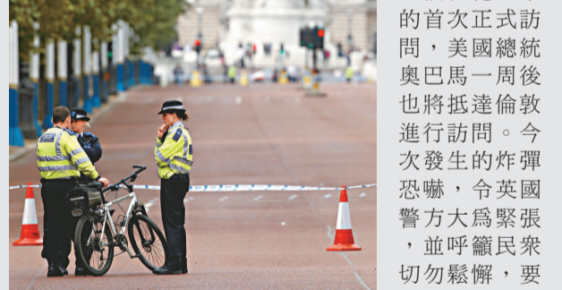
▲倫敦警方 16 日在白宮附近進行搜查

英女王伊麗莎白周二將對愛爾蘭展開一個世紀以來的首次正式訪問，美國總統奧巴馬一周後也將抵達倫敦進行訪問。今次發生的炸彈恐嚇，令英國警方大為緊張，並呼籲民眾切勿鬆懈，要繼續保持警覺，提防新一輪的襲擊。