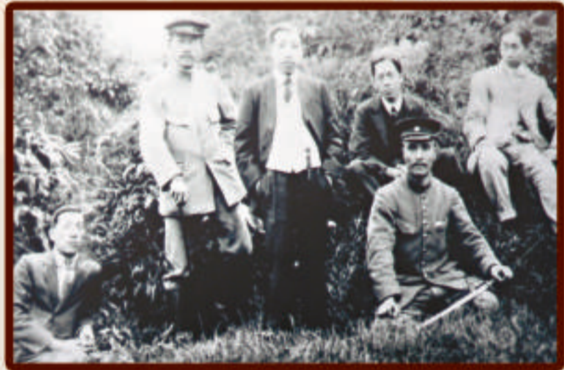
▲民國初年廖仲愷（左三）、朱執信（右一）、高劍父（左二）與高奇峰（左一）等合影