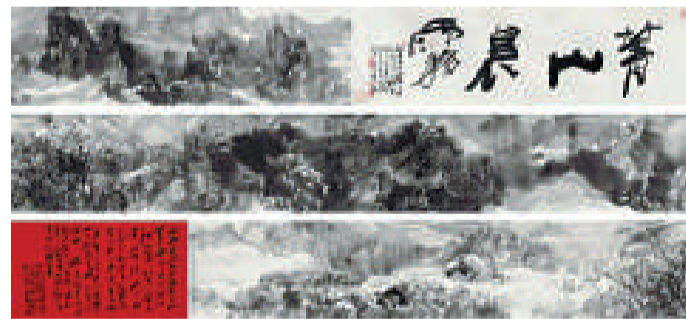
▲宋雨桂的《青山晨霧》以九百萬元人民幣成交

【本報訊】實習記者宋偉濤陽報：瀋陽日前舉辦首場春拍會，拍賣會上古董珍玩，近千幅古代、近現代及當代書畫作品紛紛亮相，當代書畫作品成為此次拍賣會的一大亮點，著名北派山水畫家宋雨桂的一幅山水畫拍到九百萬元成交，成為此次拍賣會「標王」。