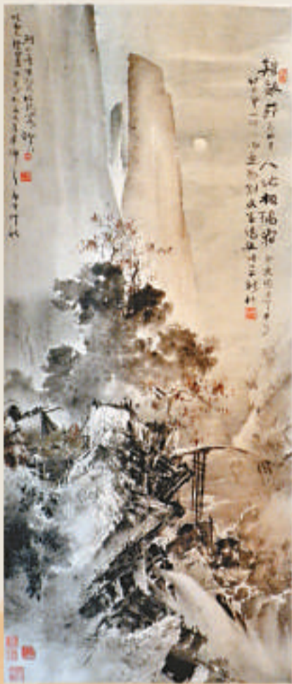
▲高劍父《雞聲茅店月》