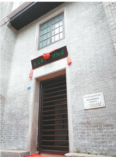
▲重新開放的蔣光鼐故居博物館