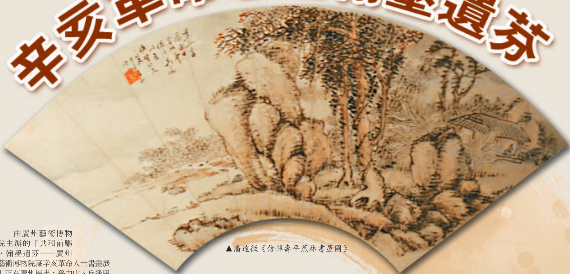
▲潘達微《仿潘壽平蕉林書屋圖》