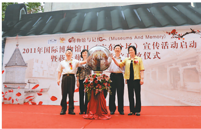
▲出席活動的國家及省市領導共同為國際博物館日宣傳活動主持啓動儀式