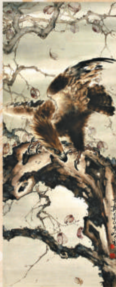
▲高奇峰《楓鷹圖軸》