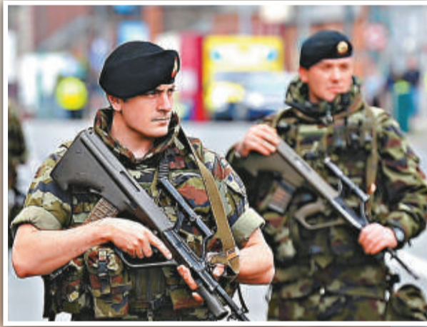
愛爾蘭士兵17日在都柏林嚴陣以待