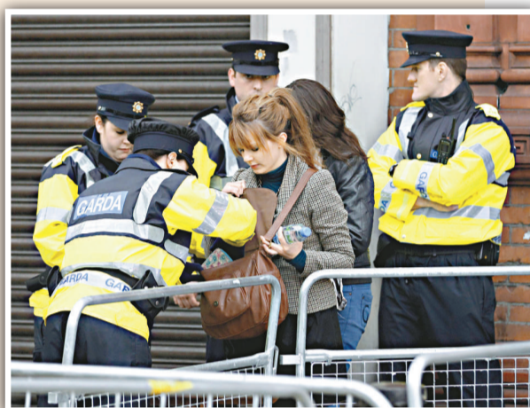
愛爾蘭警方在都柏林街頭檢查一名女性的手袋

訪問愛爾蘭第二大城市科克，到訪當地的食品市場英國市場(English Market)，以及在廷德爾研究院參觀研究設施。最後經科克機場飛返英國。(《每日電訊報》)