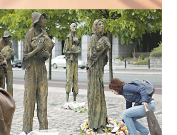
一名女子參觀紀念愛爾蘭大饑荒的雕塑