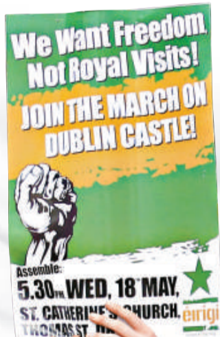
一名示威者16日在街上張貼反對英女王到訪的單張

在愛爾蘭共和軍的炸彈恐嚇之下，英、愛兩國首都處於高度警戒。倫敦派出120名武裝警員貼身保護女王；都柏林出動近萬名警員、士兵在街上巡邏，保安行動耗費2600萬英鎊（約3.28億港幣）。16日起都柏林市內封鎖了30多條街道，警犬和保安人員對電話亭、街道下水道、交通燈設施等逐一檢查後，全部用封條密封起來。就連一家婦產科醫院也因此要在未來幾日取消幾百個診症預約，整個首都如臨大敵。女王17日抵達愛爾蘭巴爾唐奈空軍基地前夕，已有500名士兵圍繞該處建立保安網。一組用來偵測低緯度飛行空中目標的「長頸鹿」防空系統正在待命，以保衛女王準備入住的法姆利莊園。