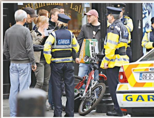
愛爾蘭警方詢問手持反對英女王到訪標語的示威人士