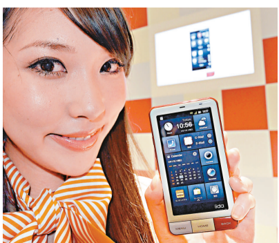
▲研究指出，多數使用谷歌Android系統的智能手機都存在安全風險

德國荷爾姆大學的保安專家周二公布上述的重要發現。漏洞會任由黑客在用戶登入包括Facebook、Twitter或谷歌提供的網路服務時，截取並收