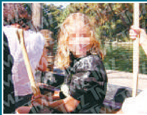
▲阿諾的私生子已長大成人