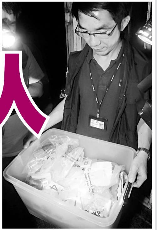
▲警員帶走賭款及賭具作證物 ▲大部分賭客都是女性 ▲警方破獲的賭檔由貨櫃箱改裝

【本報訊】該非法鄉村賭場佔地約千餘呎，燒烤場四周有草叢做天然屏障，地處偏僻，由於只有一條村道通往該處，較難被人察覺，以致被黑幫有機可乘，覬覦「環境理想」私闖賭場。該「豪華賭場」有得賭、有得食之外，還每晚開設專線接載服務，安排七人車依指定路線行駛載客。歹徒也會擔當「疊碼仔」職責，到附近屋邨物色賭客，並引領到場