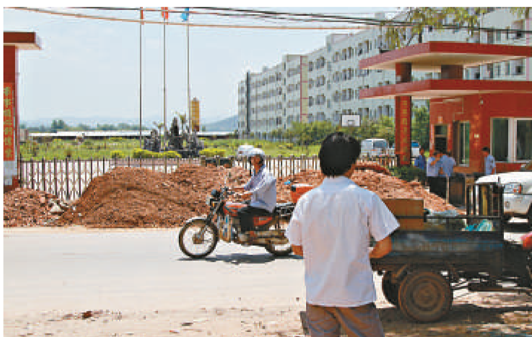
▲村民用泥土封門，阻止工廠繼續開工

據工作人員介紹，按環保評審要求，這類企業必須設置500米的衛生防護距離，並須取得危化物安全生產許可證，但三威電池均沒有做到。廣東省委、省政府表示，待調查結束後，將依法嚴懲責任人。