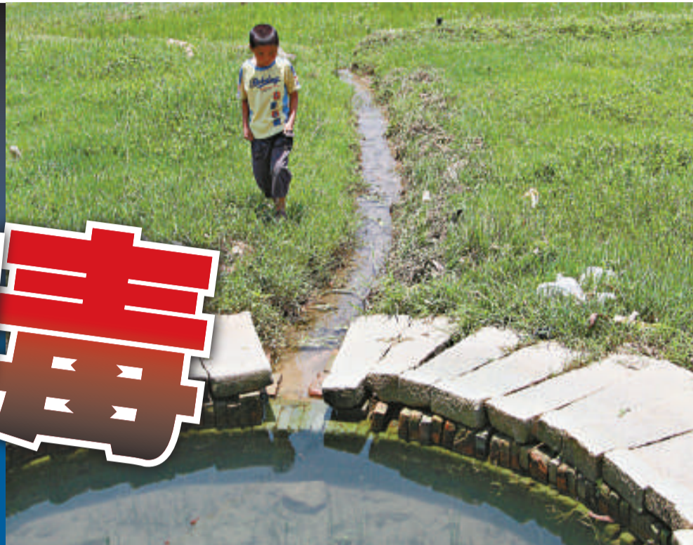
▲十九日，一名兒童在水井旁玩耍，殊不知水源可能已被污染