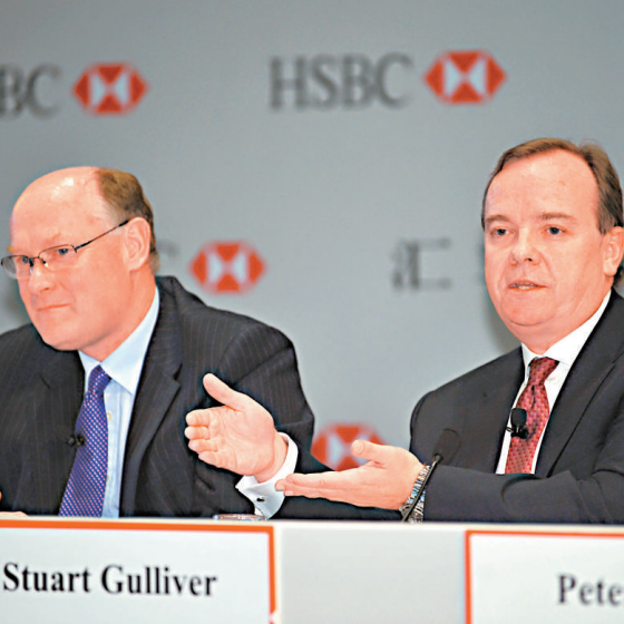
▲滙控新管治班子主腦范智廉（左）及行政總裁歐智華，昨首次在本港出席非正式股東會

的感受，但認為集團不能夠操控股價。但他認為，需要時間將新策略執行，而市場只會在有關策略執行後，才會重評股價，但他預計需時 1 至 2 年才見成效。