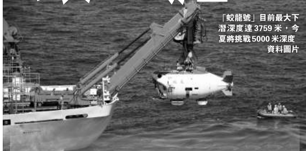
「蛟龍號」目前最大下潛深度達3759米，今夏將挑戰5000米深度

【本報訊】綜合消息：中國國家海洋局局長劉賜貴20日在北京召開的促進海洋事業發展黨外人士座談會上透露，中國首台自行設計、自主集成研製的深海潛水器「蛟龍號」擬於今夏「探觸」5000米深海，屆時「蛟龍號」有望再度刷新中國載人深潛的深度紀錄。