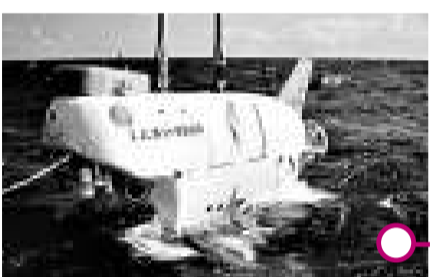
▲中國船舶重工集團公司702研究所研製成功的7000米深海潛水器 資料圖片