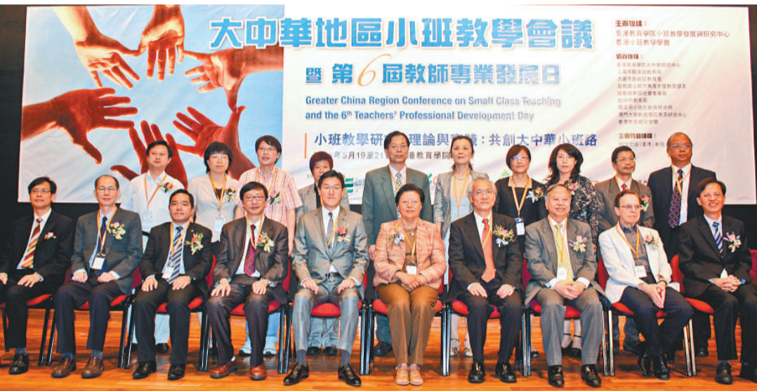
▲來自港、澳、台及內地的學者、教育官員，昨日出席教院主辦的小班教學會議，范徐麗泰（前排左六）主禮

【本報訊】實習記者孫玥報導：超過二百名來自兩岸四地的學者、官員和教師，昨天在教院出席大中華地區小班教學研討會。主禮的全國人大常委范徐麗泰表示支持小班教學的推行。她從自己兒子的經歷得出，小班教學可使教師有更多時間了解和觀察學生。