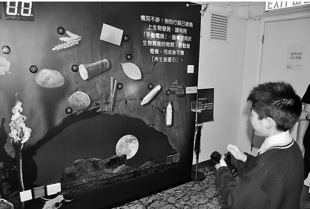
▲學生到「綠適天地」展覽館參觀，認識再生能源

為推廣環保節能，中華電力特別在旺角鬧市設立「綠適天地」、「綠D班」，以及能源效益展覽中心，讓小學生認識不同的環保知識，並推廣正確選擇及使用電器的方法。「綠D班」更是中電首間流動環保教室，提升小學生對氣候轉變和綠色生活的認識，培養環保觸覺。