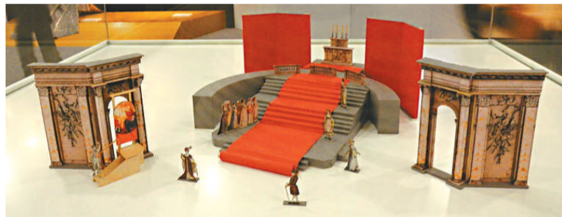
▲二〇〇九年普契尼音樂節中的場景模型