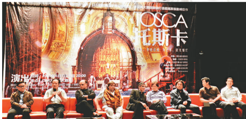
▲訪穗公演《托斯卡》的羅馬歌劇院導演、男演員與觀眾見面