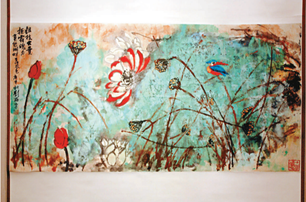
▲劉海粟作品《粗枝大葉荷花》

的，又有來自外省市的，以及台灣與美籍華人畫家，空間上亦可謂輻射廣闊，實為藝術界的一次盛會。上海劉海粟美術館位於虹橋路一六六零號，展期至五月二十六日。