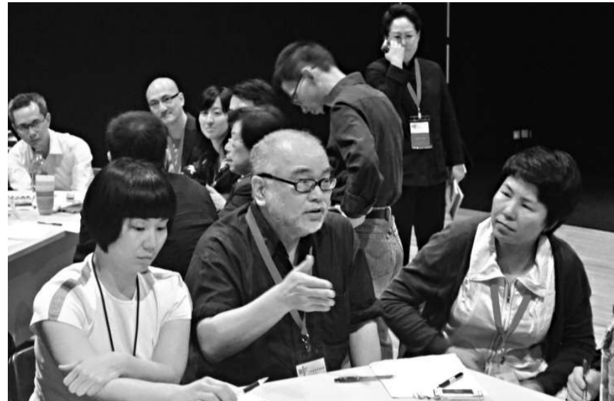
▲香港當代文化中心主席榮念曾(前中)認為，發展創意產業應首先建立創意產業智庫

治，而非採取積極介入的策略。《華人創意產業工作者研究——基礎研究報告》中提到，政府投入大量人力及財力建成的文化創意園區怎樣避免淪為政府的面子工程和地產商盈利的項目，是文創產業工作者普遍關心的問題。