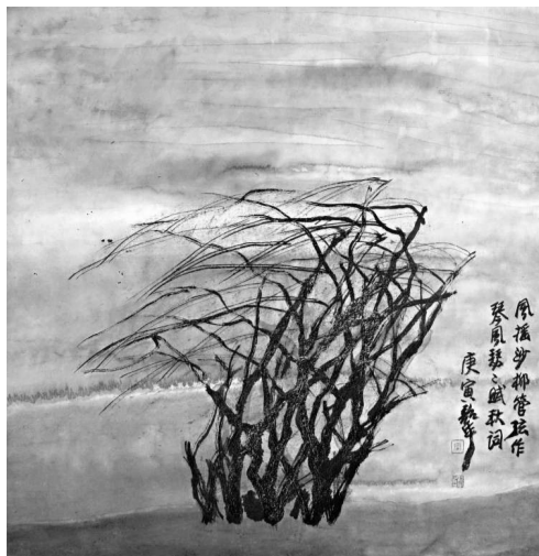
周韶華作品《琴風秋辭》