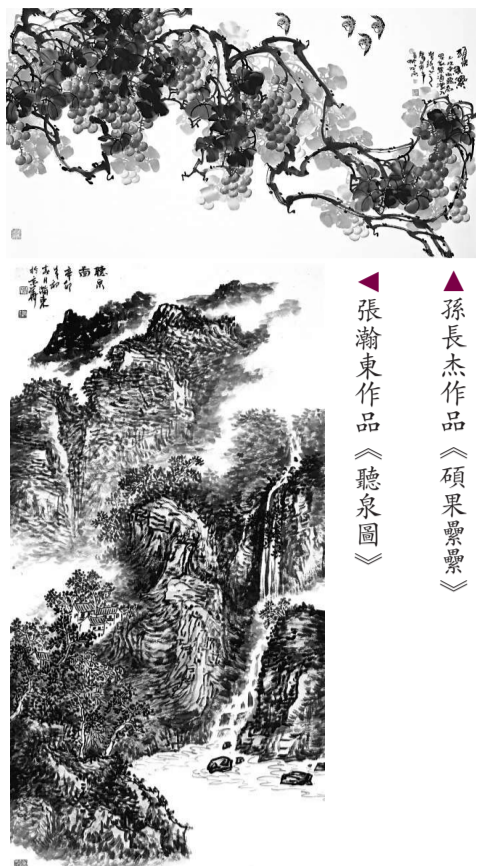
孫長杰作品《碩果累累》

【本報訊】三位國禮畫家孫長杰、朱東坡、張瀚東現於集古齋畫廊舉行「國禮畫家畫展」，展出他們多年來的創作成果。