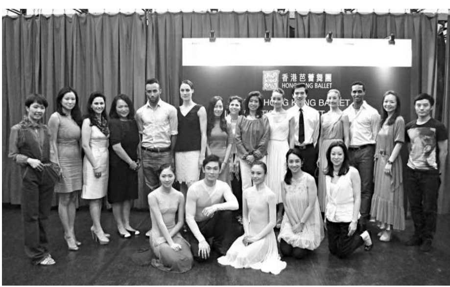
「Galaxy國際芭蕾舞匯演2011」台前幕後人員合影

與譚元元和史賓迪類似，來自英國國家芭蕾舞團的迪維亞·金曼杜華和瓦第·米達賈夫亦是新老搭檔配對。生於捷克的金曼杜華現任英國國家芭蕾舞團高級首席舞蹈員。