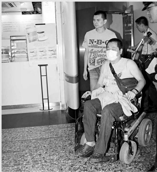
▲坐輪椅的退休警圖衝落港鐵路軌自殺，被乘客及時制止