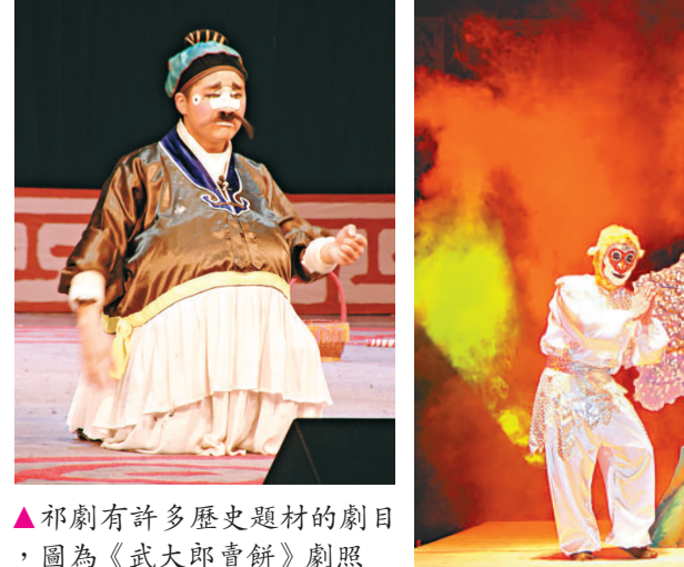
▲祁劇有許多歷史題材的劇目，圖為《武大郎賣餅》劇照