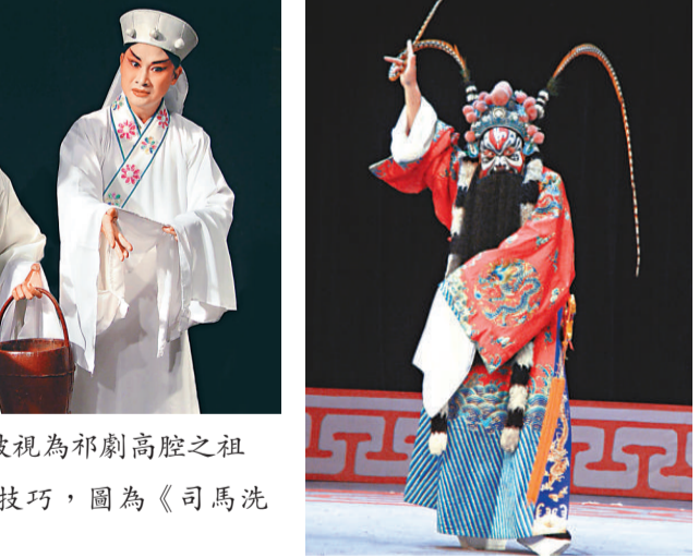
▲《目連救母》被視為祁劇高腔之祖

化貢獻獎」及「田漢大獎」第一名及九個單項金獎；又憑《夢蝶》於湖南省第三屆藝術節獲「田漢大獎」第一名及十個單項金獎。 湖南省祁劇院演出安排如下：六月十六日（星期四）晚上七時三十分舉行「祁劇的藝術特色」專題講座暨示範演出《醉打山門》，該劇為祁劇花臉重頭戲，大量使用祁劇的眼功、臉子功、腿功、肚皮功，其中還有單腿獨立連做十八羅漢造型的特技；六月十七日（星期五）晚上七時三十分演折子戲《武大郎賣餅》、《跑坡》、《昭君出塞》、《打棍開箱》、《司馬洗宮》、《啞女背瘋》、《董洪跌牢》及《黃鶴樓》；六月十八日（星期六）晚上七時三十分演高腔本戲《目連救母》，該三場演出均在大會堂劇院進行。 門票現於各城市電腦售票處、網上及信用卡電話訂票熱線發售，查詢可電二六八七三二五，或瀏覽網頁www.lcsd.gov.hk/cp。