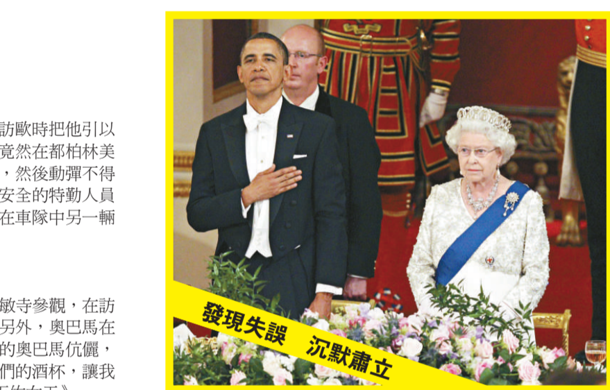
發現失誤 沉默肅立