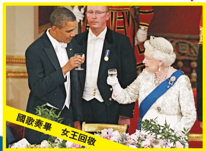
國歌奏畢 女王回敬