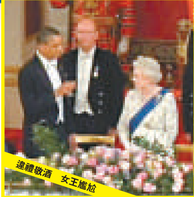
▲英女王與奧巴馬等人出席在白金漢宮舉行的晚宴 資料圖片