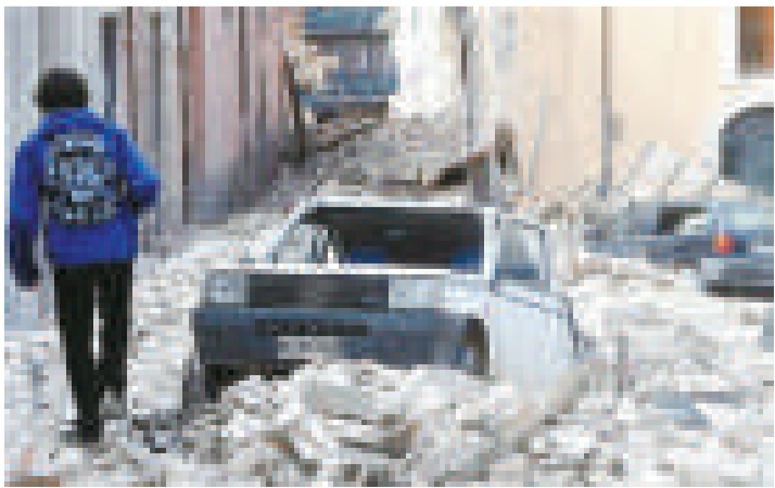
▲意大利中部拉奎拉地區的大地震造成308人死亡 資料圖片

【本報訊】據《每日電訊報》26日報導：意大利7名科學家周三被控過失殺人罪，原因是他們在2009年4月6日發生地震前，未能及時向當地居民發出警報，導致超過300人喪生。 科學家們的辯護律師稱，以目前的科學技術，根本無法準確預測地震。世界上也沒有任何一次大地震曾被預報。但法官指，「拉奎拉地區的民眾早在地震發生前6個月就感受到了地面的輕微震動，然而，被告卻向當地民眾傳遞了不準確、不完全以及錯誤的信息，未能對地震的發生提出警告。」 檢方還拿出一份2009年3月31日地震專家召開會議時的備忘錄。這次會議就是針對當時拉奎拉地區民眾擔心會發生地震而召開的。根據這份備忘錄，當時的各位專家認為，拉奎拉地區不太可能發生大地震，雖然這種可能性並不能排除。 隨後，這些地震專家在接受媒體採訪時打消了人們對地震的擔憂，並強調預測地震是不可能的。他們還說，對於拉奎拉這樣一個經常發生地震的地區來說，連續6個月發生輕微地質活動並不是什麼不正常的現象，也不意味著就會發生大地震。 2009年4月6日，意大利中部拉奎拉地區發生里氏6.3級地震，造成308人死亡。古城拉奎拉的歷史可以追溯到2000年前，城內有很多建造於古羅馬和文藝復興時期的建築物。由於年代久遠，大多數古建築物都在此次大地震中倒塌。