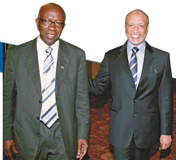
▲競逐FIFA下屆主席的亞洲足協會長穆罕默德·本·哈馬姆（右）和FIFA副會長傑克·沃納

FIFA將於6月1日舉行新一屆主席選舉，但它現在可能因為這輪貪污聆訊而被迫延期。FIFA亦拒絕證實選舉會如期舉行，但若哈馬姆被裁定貪污罪名成立，他即使當選也不可能留任，到時FIFA將要重選主席或者讓白禮達自動填補空缺。 本·哈馬姆25日堅稱自己清白，反指FIFA之所以起訴他，是因為白禮達在選舉前夕以政治手段剷除對手，又表明將會繼續競選，並會為沃納辯護（沃納被前英國足球總督特里曼指指貪污，操縱2018年世界杯主辦國投票的結果）。 本·哈馬姆和白禮達的關係本來十分密切，但自本·哈馬姆決定參選後，兩人開始不睦。這位亞洲足協會長，有份協助卡塔爾爭性地獲得2022年世界杯主辦權。