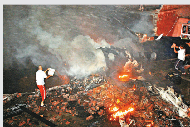
▲印度一家小型飛機26日墜落在新德里郊區，居民正試圖撲滅大火