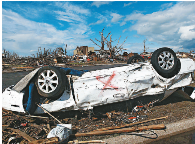
▲密蘇里州喬普林市遭遇龍捲風損毀嚴重