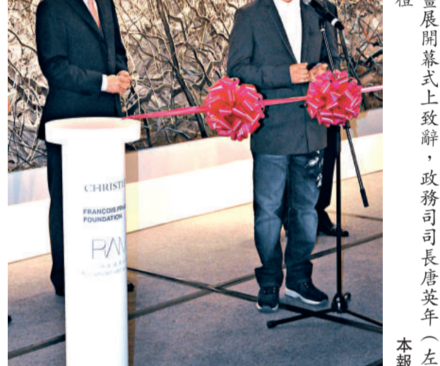
▲曾梵志在畫展開幕式上致辭，政務司司長唐英年（左）出席了開幕禮

曾梵志個展「界線的共鳴」由佳士得拍賣行與上海海外灘美術館合辦，弗朗索瓦·皮諾基金會贊助，現於香港會展中心展出，展期至五月三十日。曾梵志作品《豹》的拍賣所得將全數捐贈大自然保護協會，佳士得亦將免除此次慈善拍賣的全部佣金。