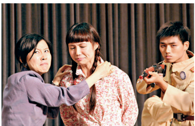
▲華南理工大學輕工與食品學院團隊演繹的《劉胡蘭》節選獲一等獎

【本報訊】記者李夢報導：佳士得拍賣行將於明日舉行「亞洲二十世紀及當代藝術」晚間拍賣會，慈善拍賣中國當代藝術家曾梵志的佳作《豹》。拍賣收益將全數捐予大自然保護協會，以支持公益環保行動。