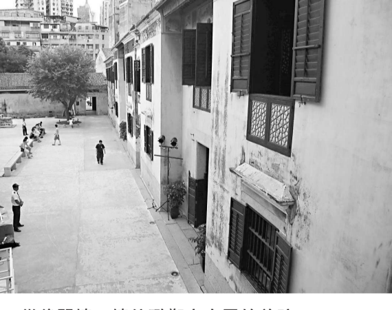
從後門樓二樓俯瞰鄭家大屋的前院

孫中山的變革思想為不少人所認識，其理論初期受鄭觀應的影響很大。譬如他起草《上李鴻章書》，提到「人能盡其才，地能盡其利，物能盡其用，貨能暢其流」的強國之道，便摘自《盛世危言》。另外光緒皇帝、康有為和梁啟超等亦深受該書啟發。