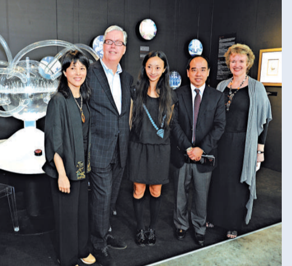
▲曾梵志在畫展開幕式上致辭，政務司司長唐英年（左）出席了開幕禮

曾梵志個展「界線的共鳴」由佳士得拍賣行與上海海外灘美術館合辦，弗朗索瓦·皮諾基金會贊助，現於香港會展中心展出，展期至五月三十日。曾梵志作品《豹》的拍賣所得將全數捐贈大自然保護協會，佳士得亦將免除此次慈善拍賣的全部佣金。