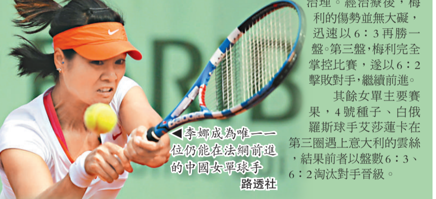
▲李娜成為唯一一位仍能在法網前進的中國女單球手

【本報訊】綜合外電法國二十八日消息:法國網球公開賽進行到第七天,中國網球好手李娜在周六的女單第三圈賽事,憑藉出色的表現以兩盤6:2完勝羅馬尼亞的莎絲迪亞,成為本屆賽事唯一能晉身單打16強的中國球手。李娜在16強的對手將是9號種子、捷克的姬絲杜娃。(now636及660 高清台香港時間週日下午5時直播)