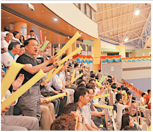
▲曾蔭權昨在馬鞍山體育館觀賞第三屆全港運動會五人足球比賽決賽