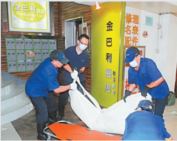
▲風流漢的屍體被昇送殮房

此外，有救生員提醒市民，西貢區多個海灣和海灘不單地處偏遠，也沒有救生員當值，一旦發生遇溺意外，便會造成救援困難；加上海面危機四伏，不時有暗流或急流大浪，不應高估自己能力和低估現場環境，亦不應過分依賴水泡及浮板等助浮工具，若本身不熟悉水性，則不應冒險獨自落水游泳。落水前應緊記先進行適量熱身運動，如果剛飲酒、服藥、進食過飽或飢餓均不宜落水。