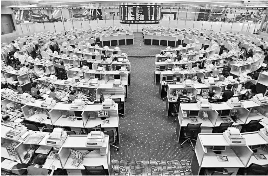
◀新興市場之父麥樸思昨日突然發表唱空言論，警告另一場金融危機迫在眉睫，進一步加劇市場疑慮氣氛