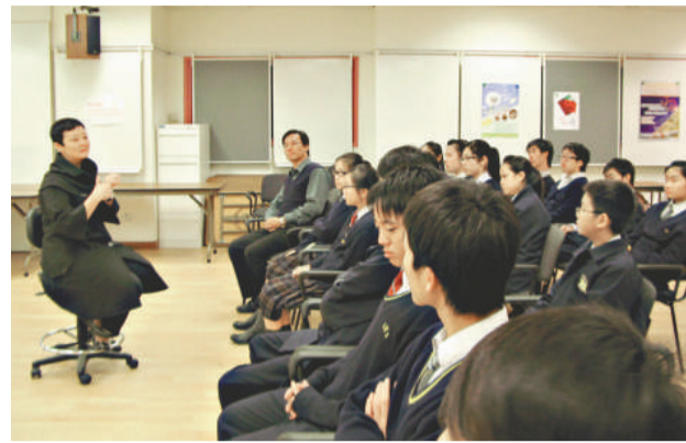
▲福建中學（小西灣）高一學生向港大學生輔導總監梁若芊請教學習通識的技巧

很多新高中的學生都感到新高中通識課程太廣泛，議題太多，不易學習。而本科卻是他們的必修科，怎樣教學生學習通識科，是每個通識科老師共同面對的問題。筆者執教的福建中學（小西灣）通識科以「走出課堂」學習的原則，主辦了一次到香港大學學習通識科活動，讓一班高一學生與香港大學學生輔導總監梁若芊博士見面，學習通識的技巧，加深他們對「個人成長與人際關係」的理解，培養專題探究的精神。