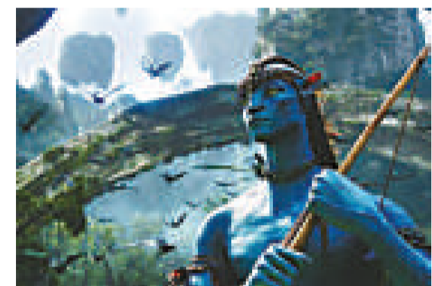
▲《阿凡達》是有史以來技術最先進的3D電影

近年3D電影再度流行，其中2009年上映的《阿凡達》可說是立體電影的重頭作，它運用了多種3D技術製作，在立體視覺上作出很多新嘗試，被譽為電影製片技術上的突破，製作費高達23億港元。3D電影的誕生，要多得19世紀的英國科學家發現了這個有趣現象：人有兩隻眼睛，兩眼之間的距離大約3.5至5厘米。而且兩隻眼睛看同一樣東西，角度不盡相同，右眼看到的，有部分是左眼看不到；左眼看到的，有部分是右眼看不到。科學家發現，兩眼之間起着互補作用，雖然兩眼看景物的角度差距很小，但經視網膜傳到大腦，就能分辨景物前後遠近，從而產生立體感。1839年，科學家溫特斯頓（Charles Wheatstone）利用這種視差原理，發明