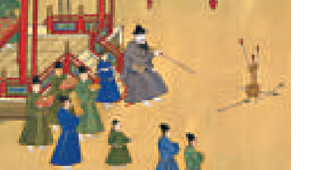
▲投壺在中國有幾千年歷史

舊中學會考中國語文課程中有《醉翁亭記》一文，作者歐陽修記敘與民同樂時有這樣的描述：「射者中，弈者勝。」其中的「射」是指「投壺」，這是古時一種十分流行的遊戲，現代已幾乎銷聲匿迹了！有人在韓國旅遊時曾嘗試一玩，都說韓國文化很有趣，這又是禮失而求諸野的一例！投壺起源於周代，直至清代而歷久不衰。它是宴會時愉悅賓客的一種遊戲，源於六藝之一的射禮，由於庭中不宜射箭，於是改為以手投無鏃羽的竹箭進盛酒的器皿中。宴會時，主人會邀請賓客參與投壺，賓客先是婉拒，雙方客套一番後比賽才正式開始。一般來說，主客每人4箭，輪流投箭入壺，位尊者置箭於地，投一枝拾一枝；位卑者則一手抱箭於懷，一手投箭。整個活動顯得隆重，有「司射」擔任司儀，「禮生」負責唱贊，「弦者」擊鼓助興。投中者獲賞若干「算」，這是計分的條狀物，插在伏鹿形的「中」上，「中」上的「算」最多者勝出，輸者罰飲酒。投壺初時禮的意義重於遊戲，例如賽前賽後雙方都要揖手行禮，後來趨向玩樂，以奇特的招式取勝，文人學者大為不滿，宋代司馬光便撰《投壺新格》一書，希望重新喚起人們對投壺禮儀的