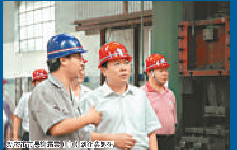
新密市市長謝霜雲(中)到企業調研