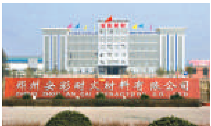
▲鄭州安彩耐火材料有限公司

新密資源豐富、經濟繁榮，是全國重點產煤縣之一、全國耐火材料基地，也是著名的石、玉、陶之鄉。工業經濟起步較早、基礎較好，共有35個門類，煤炭、耐火材、建材、造紙等傳統產業逐漸提升，電力、服裝、食品、醫藥等新興產業協調發展，文化旅游、房地產等綠色產業異軍突起。目前，全市共有工業企業1552家。