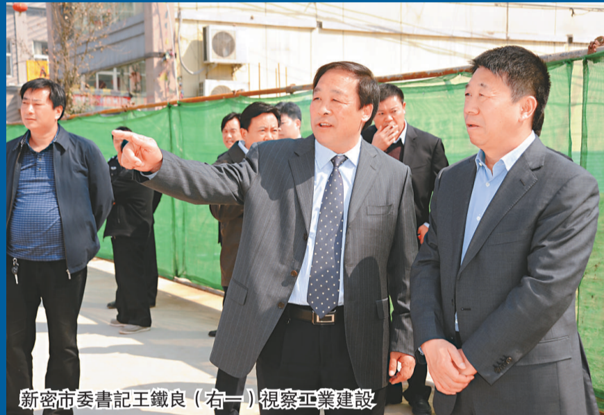
新密市委書記王鐵良(右一)視察工業建設

瞻望未來，任重道遠。新密市將在上級黨委、政府正確領導下，帶領全市人民，深入貫徹落實科學發展觀，銳意進取，奮力開拓，為把新密建設成為「乾淨整潔、結構優良、富足文明、風清氣正」的現代化時尚宜居城市而努力奮鬥。