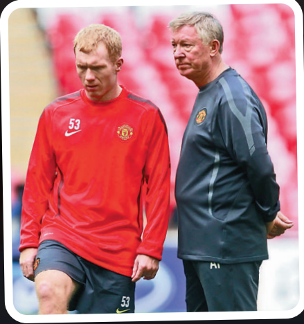
▲曼聯領隊費格遜（右）絕對是史高斯的恩師