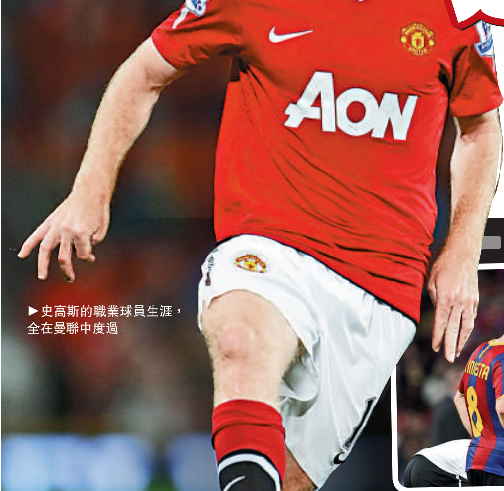
►史高斯的職業球員生涯，全在曼聯中度過