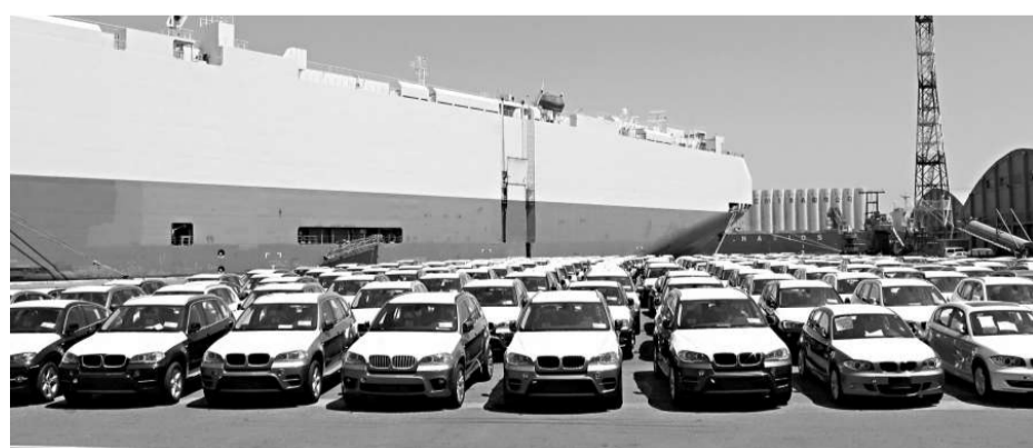
▲趕在奢侈稅實施前的最後時刻，巴拿馬籍馬托邦公爵將汽車船載着千輛進口車抵達台中港，工作人員忙着將名車駛下船

台灣立法機構4月15日通過的條例規定，「奢侈稅」的徵收範圍涉及不動產、交通、保育、傢具等方面，最高稅率將達15%。其中，不動產類鎖定的是短期交易的非自用住宅，旨在打擊炒房行為。在高消費貨物部分，購買非用作大眾運輸工具的飛機及豪華遊艇，高爾夫球證及俱樂部會員證，以及皮草、龜殼、玳瑁和珊瑚等製品，如達到一定金額都要徵10%的稅。