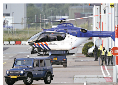
▲一架直升機將姆拉迪奇載往海牙國際法庭

【本報訊】綜合法新社、中新社1日消息：前波斯尼亞塞族部隊司令姆拉迪奇周二已被押送到荷蘭，暫時被收押在海牙的監獄裡，他將在海牙的國際戰爭罪法庭接受審判。如果罪名成立，姆拉迪奇有可能被判終身監禁。 周二晚7時45分，押送姆拉迪奇的飛機由貝爾格萊德飛抵荷蘭鹿特丹機場。隨後，在當地機場逗留約90分鐘後，姆拉迪奇再由一架直升機押送到海牙附近的南斯拉夫國際戰犯法庭拘留中心。 在拘留中心內，多名戴頭盔並手持自動步槍的獄警戒備，在直升機降落期間一直在中心巡邏。一支黑色車隊也駛入拘留中心，但傳媒看不到姆拉迪奇本人。 在未來的一段日子裡，姆拉迪奇將在聯合國拘留中心生活，等待審訊。據了解，拘留中