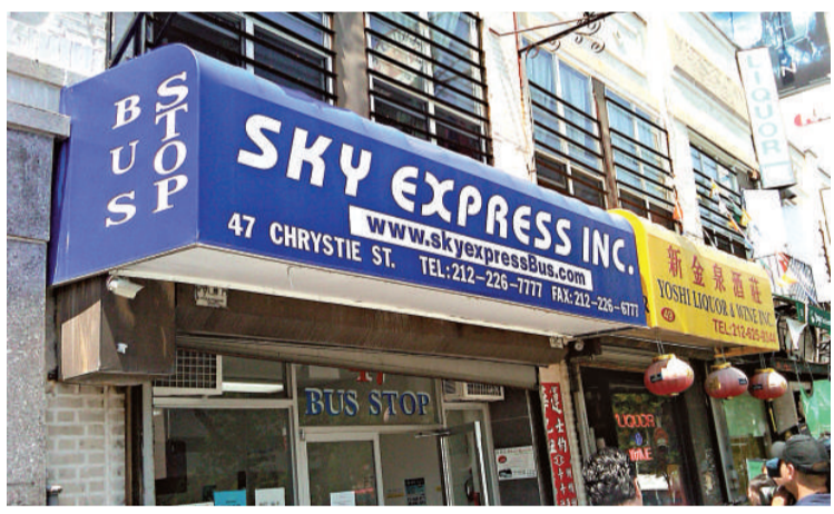
▲「華運」巴士公司設於紐約唐人街的售票處

【本報訊】據《紐約時報》網絡版5月31日報道：繼弗吉尼亞州發生致命巴士撞車事故之後，紐約州議員周二要求對旅遊巴士業採取更嚴格的管制。 自3月發生一宗導致15人喪生的巴士撞車事故以來，議員們一直都在敦促立法管制巴士。 雖然巴士公司一般都受到聯邦規章的管制，但紐約州運輸部希望獲得權要求當地巴士公司申請許可證。代表曼哈頓和布魯克林的參議員丹尼爾·斯考德倫說：「我們可以在本地做更多事情。設立本地標準，可以讓市政府知道巴士司機是誰以及其他相關資料。這還將使紐約市與聯邦管制當局加強合作，監管那些風險最大的公司。」 雖然市議會已通過立法，但該法案的兩個版本仍在參議院傳閱。斯考德倫說：「在概念上，大家都認為這是好主意。現在的困難是敲定細節，以及在本季議會結束前立法生效。」斯考德倫說，他希望該立法可以改善整體的巴士管制。 他說：「現時巴士業情況混亂。設立許可標準之後，我們可以及時發現問題，在問題變成悲劇之前予以阻止。」 此外，紐約州參議員史葛靜、州眾議員蕭華、紐約州議員陳倩雯周二下午在「華運」公司門前舉行記者會，呼籲紐約州參議會儘快通過在唐人街設立巴士停車點以及加強巴士業安全的議案。