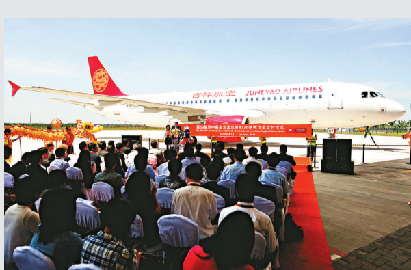
▲第50架空巴A320系列飛機在天津空巴320總裝線下線，交付給吉祥航空公司

韓國是全球主要造船國，截至今年首季，新增造船訂單量反超中國，該國亦是多家國際主要航運公司的基地。訪問團今次造訪韓國海洋水產開發院、韓國造船協會、韓國海事大學、韓國SK航運、STX 泛洋、現代商船、韓進航運。業內上月底曾傳出，STX 大連船廠計劃明年初來港上市集資。