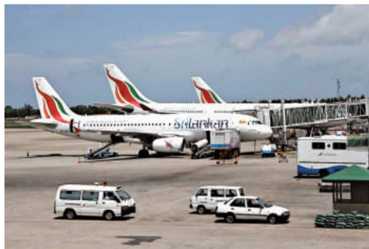
▲至2015年，班達拉納克國際機場容量將達1300萬人次

總股息升至3168萬美元，同比增長58%。SATS在該財政年度，尤其是財年第四季，面臨的主要困難是物料成本的飆漲，全季物料費41.1%的增長和工資支出35.1%的上漲還是給機場增加了不少壓力。據悉，全季物料費成本約達1.15億，工資支出約達1.55億美元。另外，機場的運行費用增長29.8%。