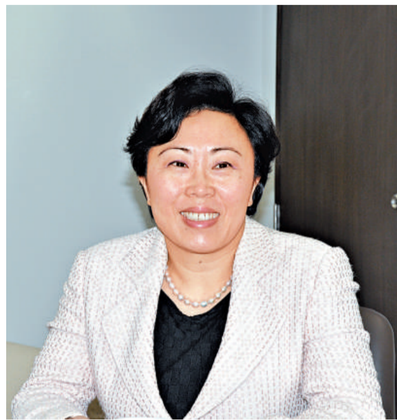
▲鄭汝樺認為，海外航運企業在本港具備長足發展優勢，是打入內地市場的絕佳平台