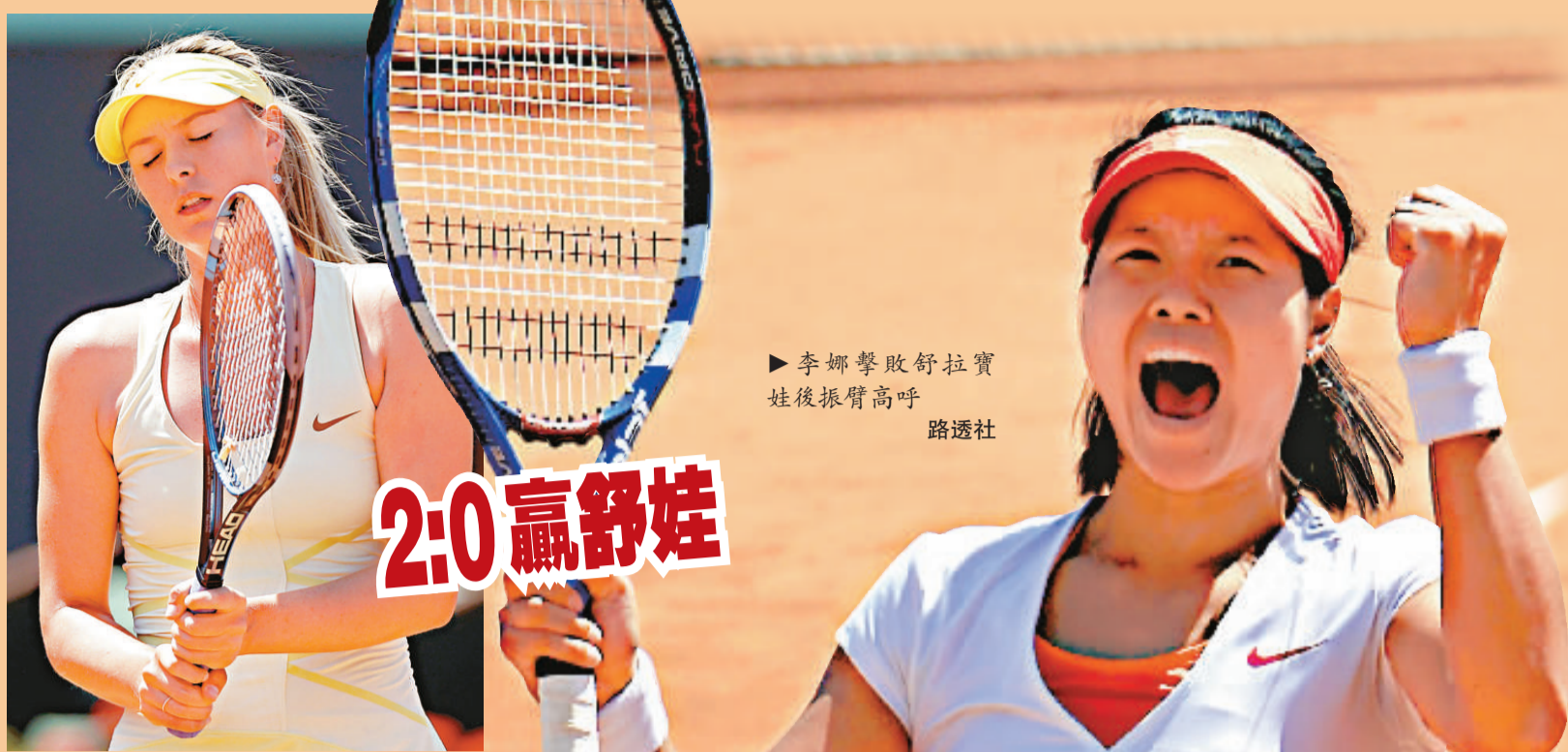
李娜擊敗舒拉寶娃後振臂高呼