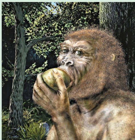
►「出嫁」的風俗可能在人類遠祖南方古猿的社會中就已存在