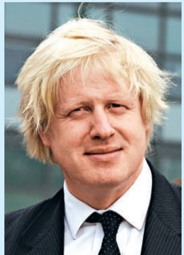
▲倫敦市長約翰遜承認他申請了好些項目的入場票，結果一張也沒能得到

【本報記者黃念斯倫敦二日電】倫敦2012奧運攪珠售票六月一日零時起結束，180萬申請奧運門票者有人歡喜有人愁，平均每7人當中有1人完全得不到票，倫敦市長約翰遜的申請也落空。