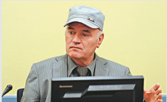
▲姆拉迪奇3日在前南刑庭出庭接受法官詢問

【本報訊】據新華社海牙3日消息：前波黑塞族部隊司令姆拉迪奇3日在前南刑庭出庭接受法官詢問，但沒有正面回應法官對他涉嫌犯下種族滅絕罪、戰爭罪和反人類罪等的指控。前南刑庭宣布，將在7月4日再度開庭繼續對姆拉迪奇進行詢問。