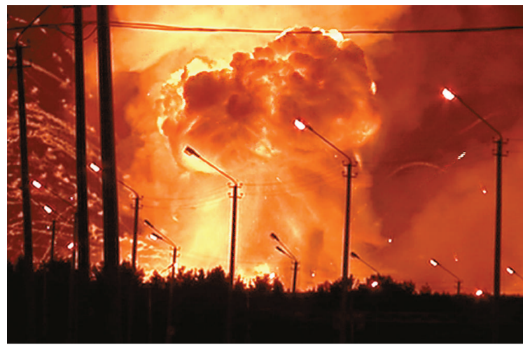
▲俄羅斯當地電視台拍攝到的畫面顯示，烏德穆爾特共和國的一處軍火庫在爆炸後產生熊熊大火

這是最近兩週以來俄羅斯境內發生的第二起軍火庫爆炸事故。5月26日，距離巴什科爾托斯坦共和國首府烏法市約100公里的一處軍火庫起火，並引起炮彈爆炸，造成10餘人受傷，50多棟房屋被毀，160人無家可歸。