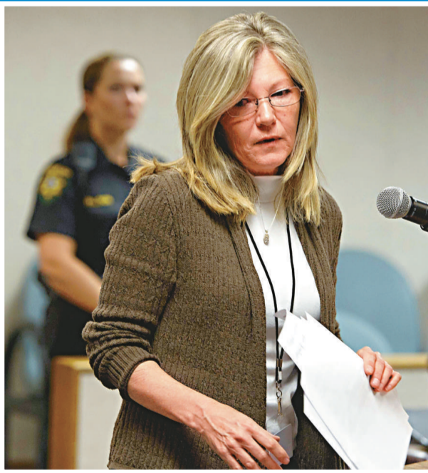
▲傑西的母親2日代替傑西出庭