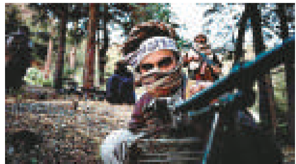
▲美國和英國正敦促聯合國取消對18名前阿富汗塔利班高官的制裁 資料圖片

解除制裁令需要聯合國安理會五個常任理事國的同意。俄羅斯已表明它目前反對任何此類舉措，並且可能會阻止任何大規模解除制裁令的行動。法國支持解除，