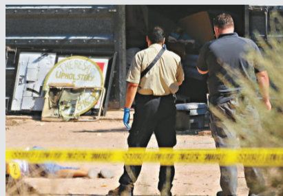
▲尤馬縣警方封鎖槍擊現場

【本報記者黃曉敏紐約二日電】美國亞利桑那州西南部的尤馬縣周四發生連環槍擊案。73歲的兇手凱里槍殺5人後吞槍自盡。兇手曾與前妻陷入離婚訴訟，懷疑該案因家庭糾紛引起。