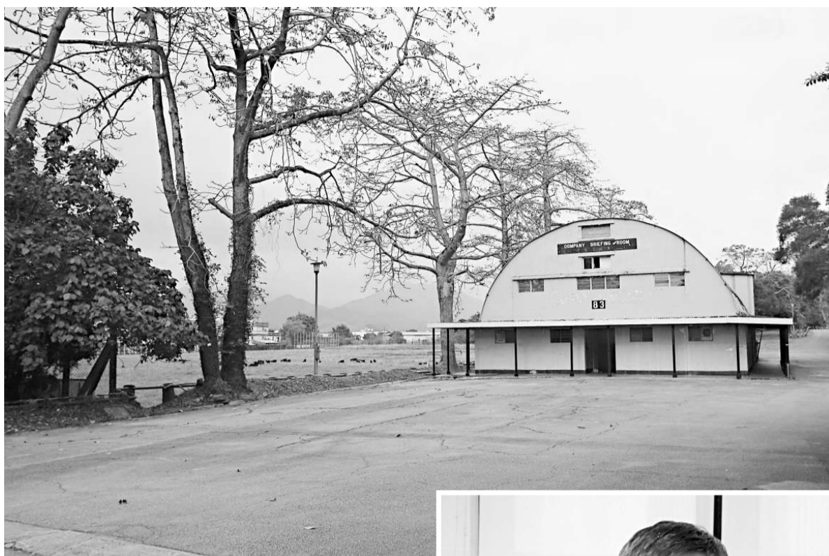
▲政府去年財政預算案宣布，撥出粉嶺皇后山前軍營用地，供院校申請開設私立大學，日前截止申請，教育局共接獲9份意向書 資料圖片

耶穌會在全世界各地有幾十所大學，包括波士頓學院、東京上智大學、韓國西江大學等。在香港則成立了兩間華仁書院，更成為高官和狀元搖籃，特首曾蔭權、教