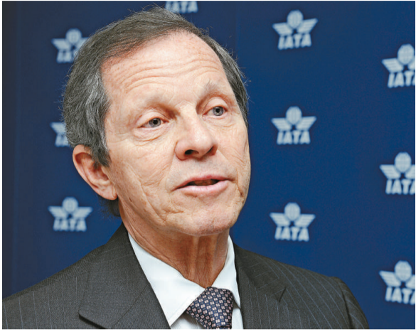
▲ IATA 理事長皮西尼亞尼卸任在即 彭博社

國際航空運輸協會 (IATA) 年度大會將於下周一舉行，國際航空業已聚首新加坡。亞太航空協會 (AAPA) 總幹事赫德曼表示，在油價高企情況下，航空公司至少要加票價一成，才可補貼油價急增帶來的額外成本。由於不少航空公司現時在油價對沖合約上已趨於保守，他估計油價突破每桶 120 美元後，航空業今年就要虧損。