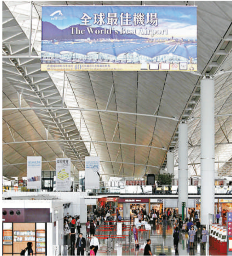
◀ 香港機場獲「最佳機場」橫額掛在機場大堂

「競爭對手看好快速發展的航空業以及由此帶來的經濟發展機遇。北京於 2008 年完成了首都國際機場的擴建，旅客吞吐能力達到 8200 萬人次。同時，為滿足城市的發展要求，政府正在規劃第二座大型機場。上海浦東國際機場計劃擁有 5 條跑道，旅客吞吐能力將達到 8000 萬人次，貨物吞吐能力達到 570 萬噸。為尋求發展和保持競爭優勢，香港需要第三條跑道。」皮西尼亞尼強調。