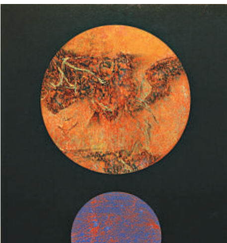
▲劉國松於一九六九年創作的作品《地球何許？之五十品》。

有關展覽資料，可瀏覽藝術館網頁 hk.art.museum ，或致電二七二一〇一一六查詢。