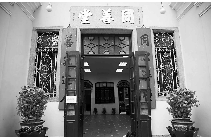
同善堂於一九二四年遷入澳門庇山耶街現址

在香港，華人慈善團體的起步亦很早。東華醫院創辦於一八七〇年，比鏡湖醫院早一年，目標都是贈醫施藥。七年後保良局成立，以「保赤公良」爲宗旨。九龍方面以樂善堂最早，一八八〇年成立。華人慈善團體的出現反映華商勢力的崛起，一方面發揚行善的傳統美德，同時亦彌補了政府在醫療福利服務方面的不足。