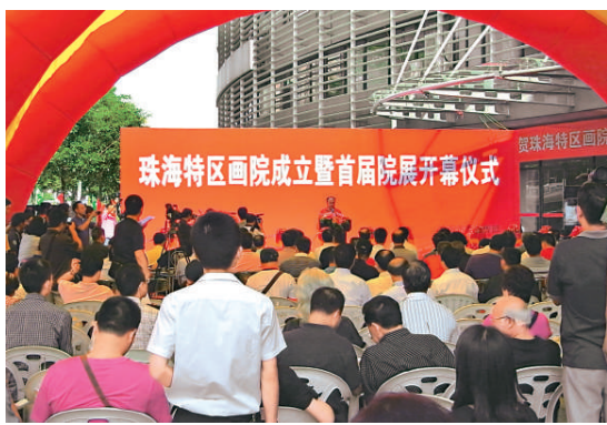
▲珠海特區畫院日前成立場面熱鬧隆重