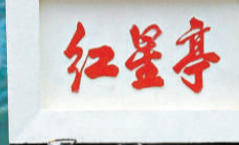
▲紅星亭前刊刻有熊炬專為紅星亭所作的楹聯