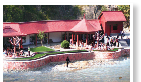
文、圖：本報記者 柳海林

據說在古時，當地男女常為洗浴爭池，為此曹靖華之父曹植甫從中調停，最後約定女子洗浴時間為農曆的初三、初六、初九、初十，其餘時間均為男子洗浴。此後，一年四季裡，男女都能夠按約定時間，在大河岸邊，輪日裸浴，向着藍天白雲，盡情淋浴，眾目睽睽之下，旁若無人，呈現出「天人合一」的原始風情。遠遠望去，如一幅流動的人體水墨畫，令無數外來度假的遊客感嘆、稱奇。