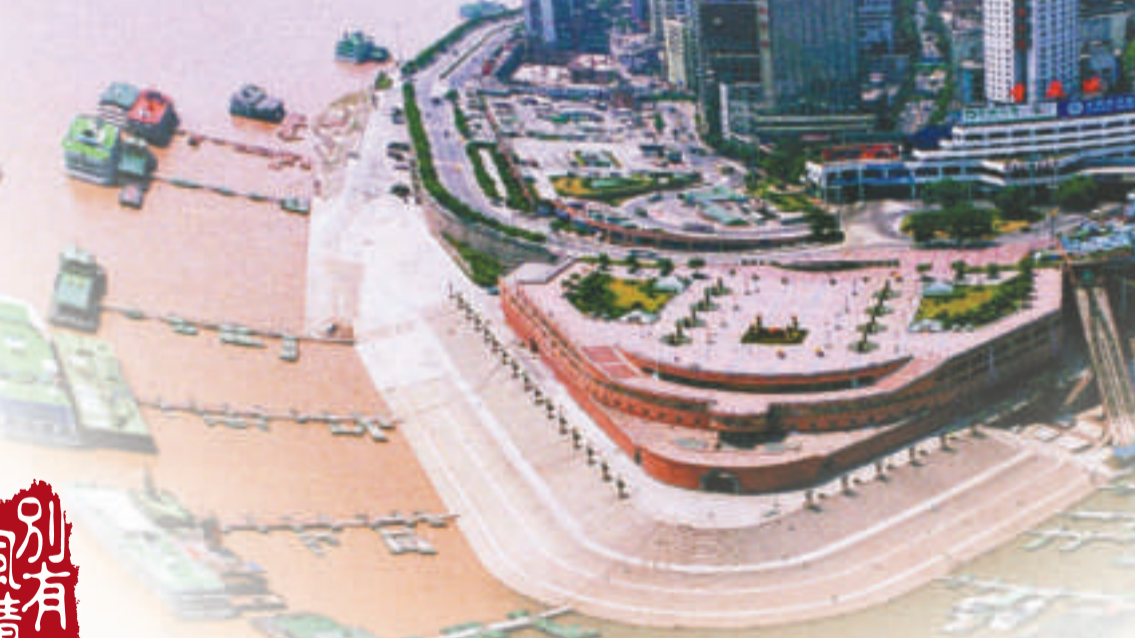
►登枇杷山公園鳥瞰重慶風光