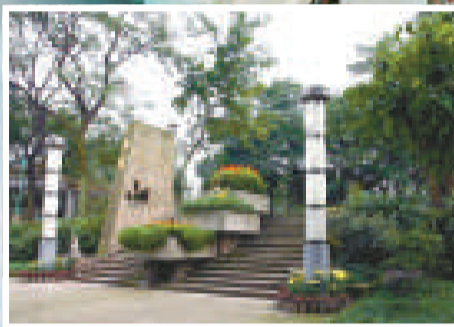
▲枇杷山是重慶市肺葉