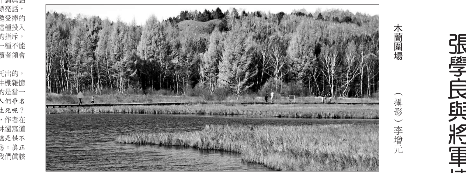
木蘭園場

第四個例子，是緊接着第三個例子說的。大概喬世華自己也覺得第三個例子太不像話了，於是來了一個轉折：「不過，錢鍾書對魯迅《阿Q正傳》並不好看，倒是真的。」這是錢鍾書答水島問的話，他首先肯定「魯迅的短篇小說寫得非常好」，接下去才說了魯迅「只適宜寫Short-winded『短氣』」的篇章，不適宜寫「長氣」的，像