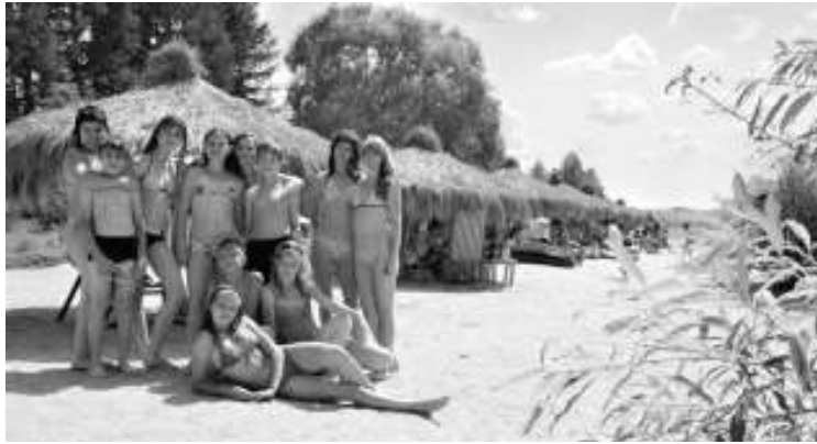
▲臥牛湖水上樂園使俄羅斯遊客流連忘返

界江之上兩國邊城風光盡收眼底，跨過千米界江開始異國風情之旅，足不出戶欣賞異國歌舞、品嚐異國傳統美食、享受異國教育資源，這種邊境旅遊的優勢在中俄沿邊地區獨一無二。 黑河，可能是俄語普及程度最高的內地城市。這裡人人都能說幾句俄語。酒店服務員、商店售貨員、出租車司機和早市的小商小販的俄語流利程度，尤其是俄羅斯民間俚語、方言土語的掌握程度，常常使來自其他省市的高級俄語專家學者瞠目結舌、嘆為觀止。 俄羅斯商品街和大黑河島國貿城的俄羅斯民用商品，應有盡有，從吃的麵粉、麵包、餅乾、巧克力、酸黃瓜、香腸、各種魚、罐頭、海參、大馬哈魚籽、黑魚籽，到喝的咖啡、飲料、果酒、香檳、啤酒、伏特加，從莫斯科的油畫、若斯托沃的鐵裝飾畫、霍赫洛馬的木裝飾畫、帕列赫的微型漆畫，到謝爾吉耶夫的套娃、格熱利的藍花瓷器、雅庫特的猛犸象牙、馬加丹的海象牙、科斯特羅馬的駝鹿角雕、