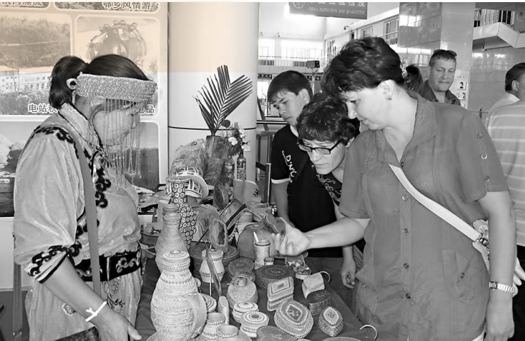
▲樺樹皮工藝品深得俄羅斯遊客喜愛

圖拉的茶炊，其品種之多，絕對超過布拉戈維申斯克的任何一家商場。 布拉戈維申斯克及其所能輻射到的俄羅斯遠東地區，蔬菜、水果、服裝等農副產品和轻工產品，又幾乎全部來自黑河。所以，俄羅斯人就直接來黑河買菜，到黑河購物。每到周末或假日，黑河成了他們最好的選擇，平均每天3000多人，最多的時候，達到7000多人。 黑河出台了維護俄羅斯人權益的意見，各主要街路、各大商場及公共服務窗口均使用中俄雙語牌匾，所有服務場所都實行中俄雙語明碼標價，公共服務電話全部實行中俄雙語接聽。互貿區生活環境舒適、商品物美價廉、治安環境良好，吸引俄羅斯遊客。 黑河市與布拉戈維申斯克市、克拉斯諾亞爾斯克和涅留恩格列，都是友好城市。政府部門與布市對應部門大多建立了穩固的友好合作關係。每年除了常規的定期工作互訪之外，還共同組團深入中俄兩國各地招商，成為中俄友好往來的一大創舉。 在不斷深化經貿科技合作的同時，每年都聯合組織各類交流活動，其中國際兒童節、國際婦女節互訪和橫渡黑龍江3項活動，被列為中俄國家級機制化活動項目。 如果感到黑河的俄羅斯風情還不濃，你還可以拿出自己的身份證或其他資料，乾脆在黑河辦一本護照，到布拉戈維申斯克住上兩天，看看這個俄羅斯邊城與中國的邊城有哪些不同。 「十一五」時期，黑河市累計接待邊境遊客189.7萬人次，實現邊境旅遊收入64.6億元，2010年分別達到34.1萬人次、16.5億元。 今年，「中俄雙子城」理念得到阿州的積極響應。在滿洲里舉辦的中俄地區旅遊合作交流會上，黑河與阿州聯合開展了「中俄雙子城」旅遊項目推介活動，擦亮了「中俄雙子城」這塊金字招牌。