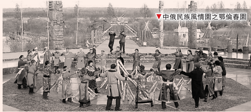
▼中俄民族風情園之鄂倫春園