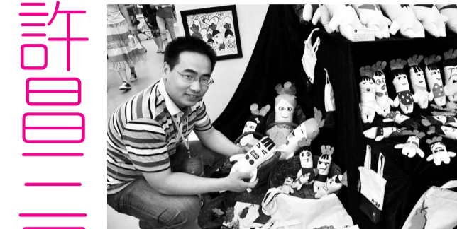
▲三國文化產品創意大賽作品展引人注目

【本報訊】記者趙長城許昌報導：中國許昌第五屆三國文化周日前開幕，以「曹魏風·許昌行」為主題，開展內容精彩紛呈的系列活動，展現三國文化的深厚文化底蘊和獨特魅力。