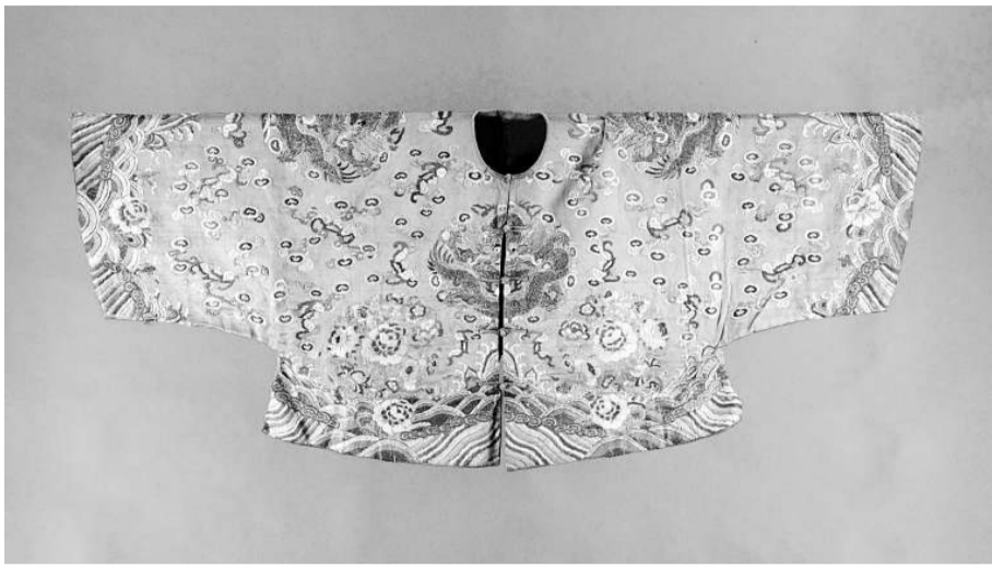
▲太平天國繡龍馬褂

洪秀全科場失意後開始接觸基督教。一八四四年，他與馮雲山「出遊天下」，並創立「拜上帝會」。清廷腐敗無能，鴉片戰爭爆發後各地民怨沸騰。馮雲山在廣西桂平縣蒙山區傳教，追隨者逾二千人。一八五一年一月十一日，洪秀全率眾於金田村起義，其後稱王，定國號「太平天國」。一八五三年三月，太平軍攻佔江寧（今南京），定為首都，改稱天京。