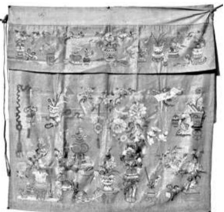
▼太平天國繡絲桌圍