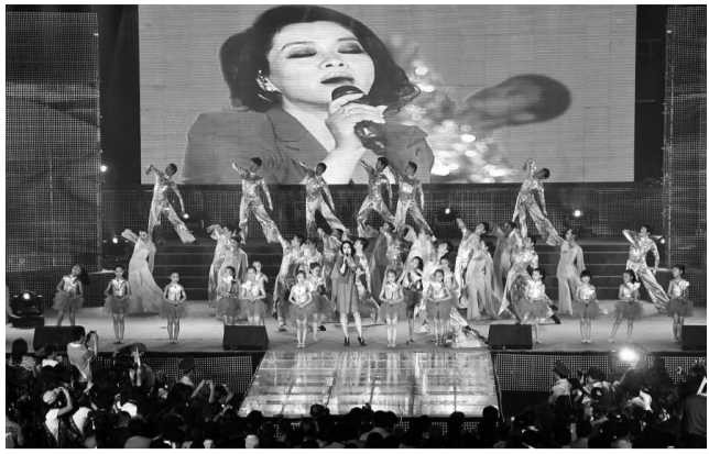
▲歌星毛阿敏在主題晚會獻唱