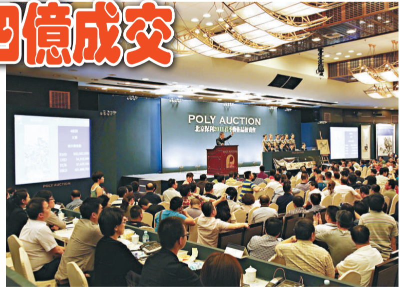
▶北京保利拍賣現場