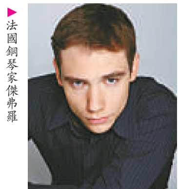
▶法國鋼琴家傑弗羅

【本報訊】為了推廣藝術和文化，法國五月策劃了系列社區外展節目，由「明日之星」鋼琴家傑弗羅·庫托（Geoffroy Coureau），連同香港電台弦樂四重奏，獻上多場跨文化音樂表演。