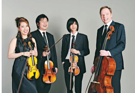
◀香港電台弦樂四重奏與傑弗羅合作演出

【本報訊】為了推廣藝術和文化，法國五月策劃了系列社區外展節目，由「明日之星」鋼琴家傑弗羅·庫托（Geoffroy Coureau），連同香港電台弦樂四重奏，獻上多場跨文化音樂表演。