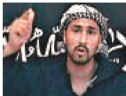
▲阿卜杜拉·艾哈邁德·阿里

畢業於城市大學，持有工程學位。他是2006年策劃用液體炸彈炸毀一架飛越大西洋飛機的主要人物。