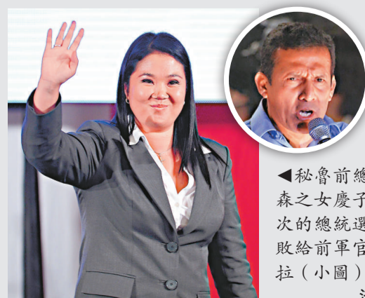
◀秘魯前總統藤森之女慶子在今次的總統選舉中敗給前軍官胡馬拉（小圖）

藤森慶子現年36歲，從19歲起就開始陪同其父親出席各種政治活動，積累了不少政治經驗。她在競選時強調公民安全、社會秩序和打擊犯罪，承諾創造高品質就業，推進教育改革，在保持經濟增長的同時努力縮小貧富差距。藤森在1990至2000年執政期間，因貪污被彈劾，又被指挪用公款達6億美元，罪成入獄。