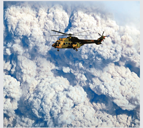
◀一架軍用飛機穿過普耶韋火山噴發的火山灰

【本報訊】據法新社聖地亞哥6日消息：智利南部河流大區普耶韋火山群4日開始的噴發目前正呈現不斷加劇趨勢，冒出高達10公里的煙柱。大量火山灰5日穿越南美大陸抵達大西洋沿岸地區，已經開始影響南美洲南部地區航空運輸，多趟航班基於安全理由要取消，超過3500名乘客受影響。