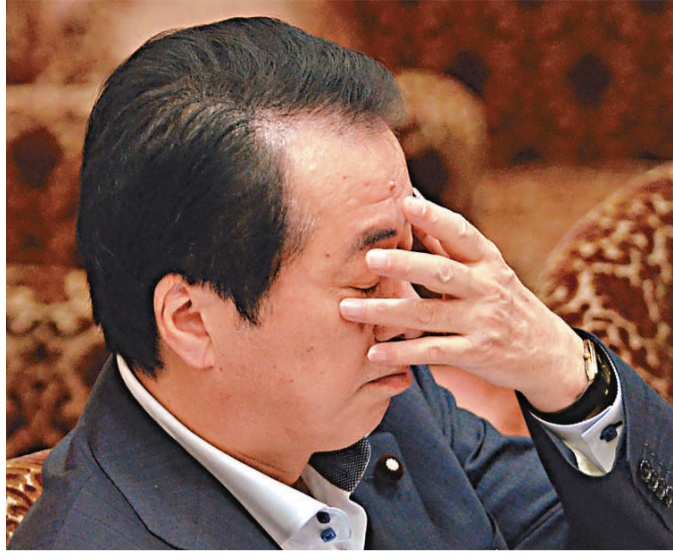
▲日本首相菅直人面臨倒閣危機