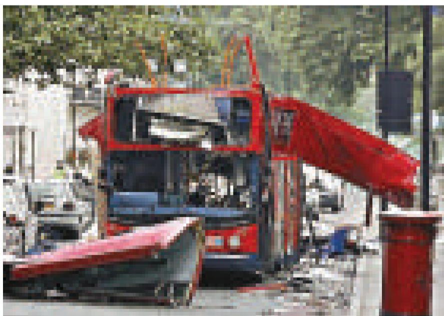
▲2005年7月7日，英國的地鐵和巴士遭恐怖分子的襲擊 資料圖片