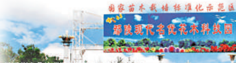
鄆陵縣十萬畝現代名優花木科技園

為了集合工業項目資源，更好地發展工業經濟，早在2003年7月，該縣就在縣城東南部規劃設立金匯產業集聚區，將有限的資源集中在一起，有利於工業產業鏈的形成，更有利於招商引資。