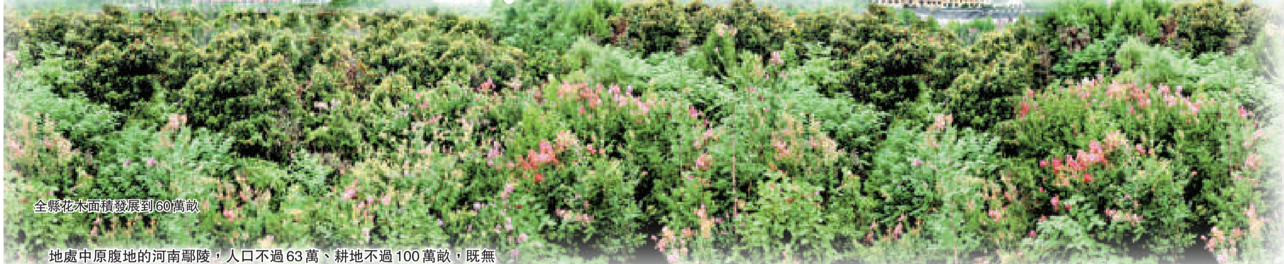
全縣花木面積發展到60萬畝

地處中原腹地的河南鄆陵，人口不過63萬、耕地不過100萬畝，既無礦產資源，又無資本優勢，堅持不懈地將一個當地農民植花種草的傳統習慣放大再放大，在豫中平原農區，闖出一條以花卉特色農業引領縣域經濟的科學發展之路，被河南省認定為發展縣域經濟的「鄆陵模式」，堪稱是一個奇蹟。