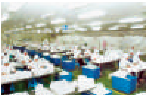
▲金匯產業集聚區內的數料生產車間

鄆陵縣金匯產業集聚區位於鄆陵縣城東南部，總規劃面積達10.7平方公里。金匯區具有明顯的交通区位优势，許亳高速、311國道橫穿東西，219省道縱貫南北。集聚區基礎設施建設累計投資13億元。建成標準化廠房35萬平方米；建成「六路一橋」，「兩縱兩橫」道路四條，總里程達18.4公里。