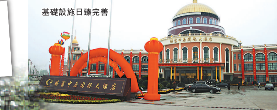
基礎設施日臻完善