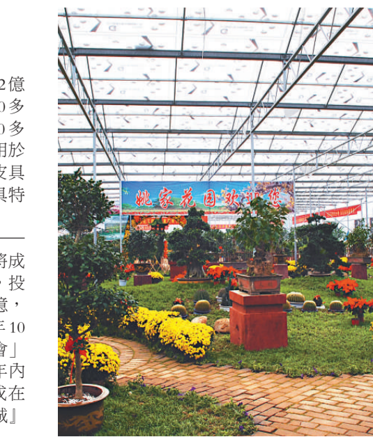
▲第十屆中原花木博覽會室內展區一角