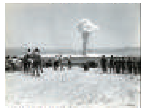
1979年9月22日。西非沿海發生的一次強烈「核爆炸」，然而，當時只有美、蘇、英等少數幾個國家擁有核武器，西非發生核爆炸的原因迄今不明。