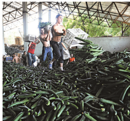
▲羅馬尼亞農民6日在布加勒斯特銷毀黃瓜

【本報訊】綜合新華社、中央社布魯塞爾6日消息：德國下薩克森州農業部6日宣布，對被疑是腸病疫情傳染源的芽苗菜的初步抽樣檢查並沒有發現腸出血性大腸桿菌。