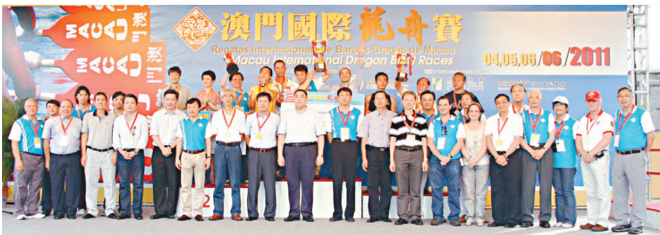
▲澳門國際龍舟賽頒獎禮大合照，前排左九為澳門特首崔世安

女子組方面，中國南海九江隊以2分05秒302封后，亞軍及季軍分別是中國天津隊及新加坡國家隊。