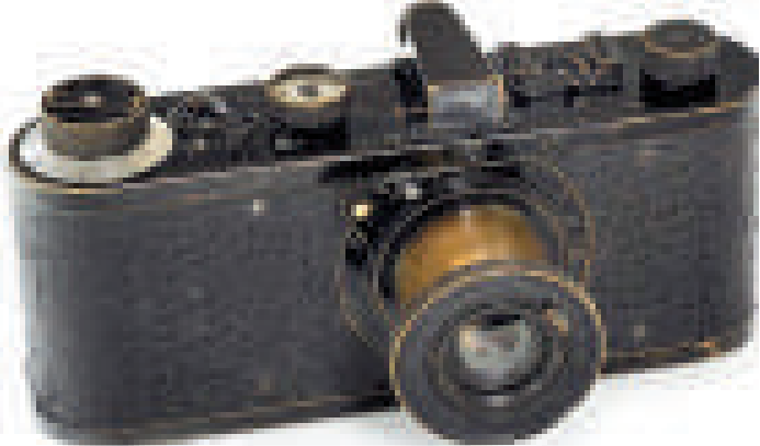
◀這款極為罕有的徠卡O系列相機以港幣1466.8萬元成交 互聯網