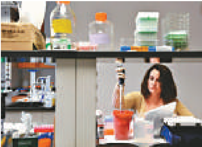
▲瑞士羅氏藥廠與日本第一三共公司研發的Vemurafenib可以將晚期黑色素瘤患者的死亡率降低63%

另外，輝瑞藥廠則為末期肺癌病患推出一種抗癌新藥，該藥在對抗某些遺傳突變的腫瘤，比一般藥物更能加倍延長病患的生命。這種名為Crizotinib的藥物，將首次針對治療全球每年增加的近5萬名病患，最後並可為輝瑞藥廠每年帶來20億元營收。 該藥的實驗顯示，末期非小細胞肺癌病患接受Crizotinib治療後，74%的生命至少可延長一年，54%延長兩年。由於至今仍有逾半數病患在世，因此尚無法確認中位數的存活時間。