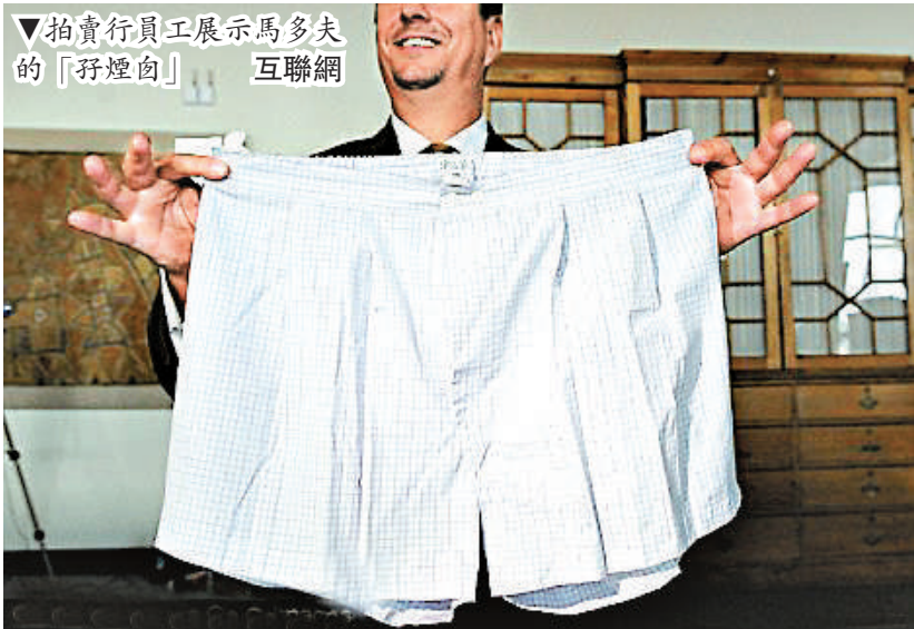
▼拍賣行員工展示馬多夫的「孖煙勾」

【本報記者黃念斯倫敦六日電】比利時鐵路太陽能系統6日啓動，每年為歐洲火車服務提供350萬瓦能源，可供每年4千火車次使用。 位於比利時安特衛普附近的E19公路旁鋪設了長達3.4公里的太陽能板，公路底下是連接巴黎西與阿姆斯特丹的歐洲高速鐵路隧道。該太陽能系統可向普通和高速火車供給能源。這一鐵路系統6日正常運作，火車乘客並沒有察覺自己乘坐了綠色能源火車。 去年10月，綠色能源公司Enfinity宣布負責這項太陽能鐵路工程，總共需花費1400萬英鎊建設。不過英國火車服務並不會受益於這項歐洲太陽能鐵路工程。 Enfinity公司發言人接受英國天空衛星電視訪問時，批評英國政府只顧及目前的緊縮經濟政策而不願投資，目光短淺。 「英國政府想當綠色能源政府，又捨不得花錢。」他不滿地說。 他透露Enfinity公司曾經對英國鐵路有同樣的太陽能項目計劃，「但是因為英國政府只是注重開支多少，忽視長期的減排目標，計劃擱置了。我個人認為這是短視的。」