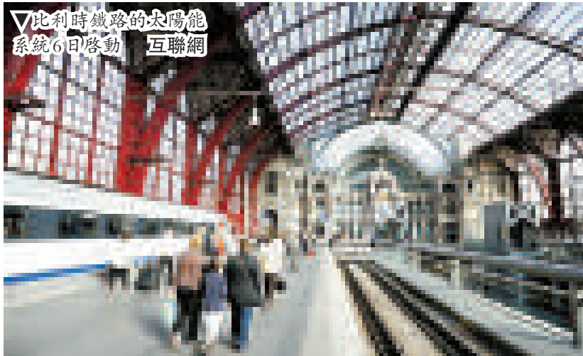
▽比利時鐵路的太陽能系統6日啓動

【本報訊】據《每日郵報》6日報道：一部極為罕有的徠卡（Leica）O系列相機，在一次拍賣中以破世界紀錄的115萬鎊（約合港幣1466.8萬元）成交，成為全世界最昂貴的相機。它雖然在1923年製造，但是至今仍然完全運作正常。 有關拍賣由奧地利維也納的Westlicht藝術廊主辦，他們形容該部相機處於「良好及完全正常的工作狀態」。該藝術廊表示，該部相機由亞洲一名私人收藏家買下，但他不希望透露姓名。 該部相機是1923年製造的約25部原型機其中之一，2年後該個德國品牌便開始商業生產。在拍賣前該相機估價約值27.3萬鎊（約合港幣348萬元）。