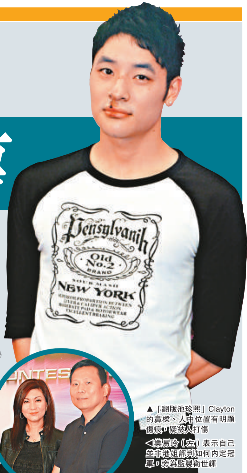
▲「翻版池珍熙」Clayton 的鼻樑、人中位置有明顯傷痕，疑被人打傷