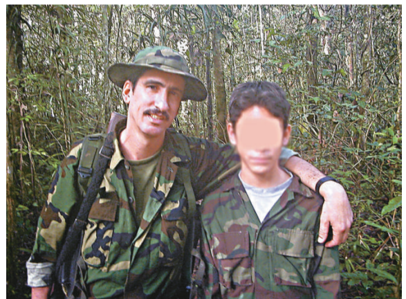
▲4名中國員工被「哥倫比亞革命武裝力量」(FARC)綁架。圖為FARC指揮官托羅斯(左)與該組織成員合影

洪磊表示，中方反對超出安理會授權的任何行動，主張尊重利比亞的主權，獨立和領土完整，尊重利比亞人民的自主選擇。中方希望利比亞有關各方能夠以國家和人民的根本利益為重，從維護地區的和平與穩定出發，盡快開啓解決利比亞危機政治解決的進程。