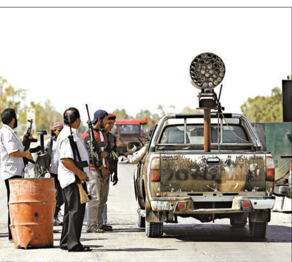
▲利比亞反對派在通往米蘇拉塔的道路上設置檢查站