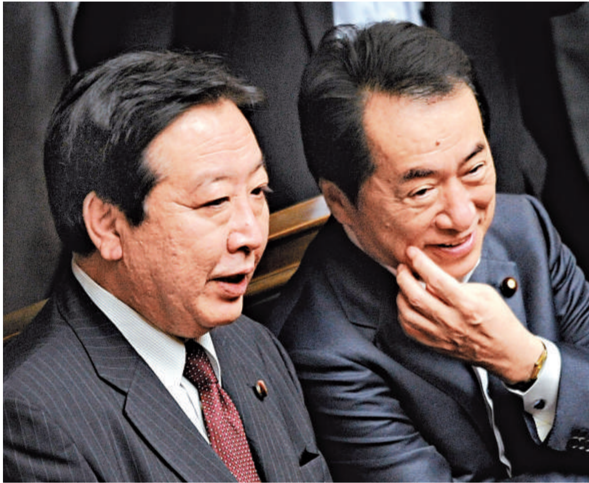
▲日本首相菅直人(右)與財務大臣野田佳彥9日出席眾議院會議

不過，菅直人再度表示，自己不會輕易辭職，因為還有許多事情沒有做完。他說：「到災區民眾能夠住上臨時安置房，處理完災區的廢墟，核洩漏事故的處理有了一定的眉目為止，我將肩負責任繼續現在的工作。」菅直人表明，他要撐到年底或明年年初才願意下台。