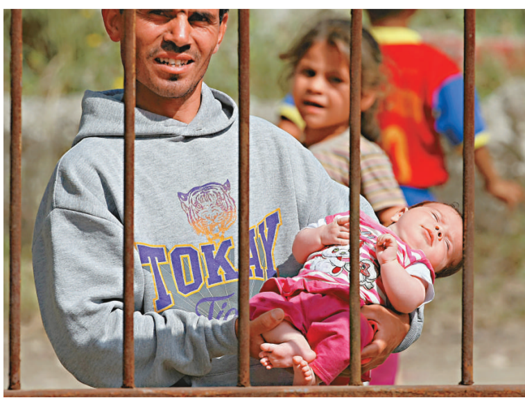
▲懷抱嬰兒的敘利亞難民在土耳其邊境的一個難民營中

在6月9日，有許多坦克與部隊聚集到這個城鎮，將當地約1000名居民疏散至鄰國土耳其。估計連日來逃到土耳其境內的敘利亞人已經超過2400人。土耳其當局檢查他們的身份後，帶他們到附近一個難民營居住。這個難民營可以接收5000人，當局正計劃在鄰近一個城鎮，興建多一個難民營，接收敘利亞難民。土耳其總理埃爾多安表示，會繼續接收所有逃難到土耳其的敘利亞人，並促請敘利亞當局應該更果斷進行政治改革，避免社會動盪。