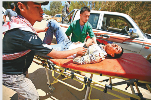
▲米蘇拉塔救援人員將一名受傷的利比亞反對派人員送往醫院

【本報訊】據法新社布魯塞爾10日消息：美國國防部長蓋茨10日警告，北大西洋公約組織(NATO)成員國的軍力不足，可能會危害北約對利比亞進行的空中打擊。