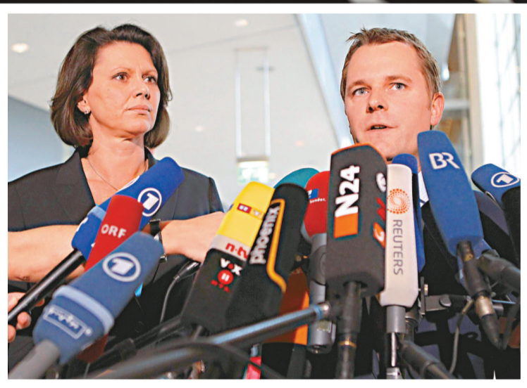
▲德國稱已確定受污染豆芽為大腸桿菌疫情來源 美聯社